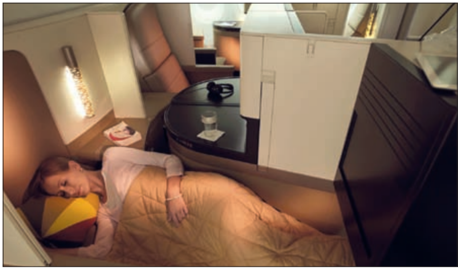
قائمة عالية على متن المقصورات الجديدة لـ «الاتحاد للطيران».