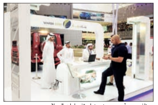
موظفو «وربة» يجيبون عن استفسارات العملاء

أعلن بنك وربة عن اختتام فعاليات أحدث حملاته الترويجية «اعتمد وربة.. حول راتيك» في مجمع الأفنيوز، بعد أن لاقت رواجا كبيرا بين أوساط عملاء ومتابعي نشاطات بنك وربة والخدمات المصرفية التي يقدمها، حيث استقطبت جناح «اعتمد وربة.. حول راتيك» في الأفنيوز العديد من المهتمين بالإطلاع على شروط الحملة الجديدة والمشاركة في فعالياتاتها.