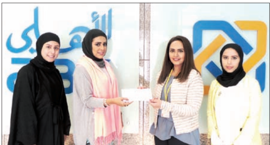
جانب من تقديم الدعم المالي لطلبة كلية الهندسة والبتترول

أعدت الاتحاد للطيران تعريف مفهوم الدرجة الأولى مع تقديمها لأول مرة على متن طائراتها طراز A380 لمقصورات «مسكن الدرجة الأولى» التي تضع معايير جديدة في صناعة الطيران التجاري. وسوف يتضمن الطابق العلوي من الطائرة تسع وحدات من فئة مقصورة «مسكن الدرجة الأولى» مرتبة بنظام المقصورة المنفردة في الصف العرضي الأيمن ومقصورة أخرى في الصف العرضي الأيسر (1L) بما يجعل منها المقصورات الأولى من نوعها في فئة الدرجة الأولى التي تضم ممرا واحدا فاصلا بين كل مقصورة والأخرى. وتتميز كل مقصورة من مقصورات «مسكن الدرجة الأولى» بوجود باب منزلق خاص بكل منها يرتفع يبلغ طوله 64 بوصة، ومقعد جلدي وثير بذراعين، مع أريكة مصممة بطريقة فريدة من نوعها مفروشة بأجود أنواع الخامات والجلود من «بولترونا فراو». ويمكن تحويل الأريكة إلى سرير منبسطة كامل الحجم بطول يصل إلى 80 بوصة.