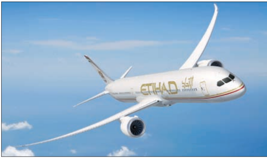
طائرة بوينغ 787 من «الاتحاد للطيران».