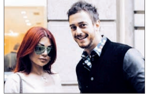
هيفاء مع سعد المجرى في ميلانو

سافرت النجمة اللبنانية هيفاء وهبي إلى مدينة ميلانو الإيطالية دون أن تعلن عن أسباب الزيارة، وانزعجت هيفاء من الشائعة التي روها أحد المواقع الإلكترونية بعنوان «هيفاء وهبي وحبيبها التونسي»، وجاء في الخبر: «اعترفت الفنانة هيفاء وهبي بأنها تعيش قصة حب وغرام مع شخص جديد، وقالت إن الإنسان لا يمكنه أن