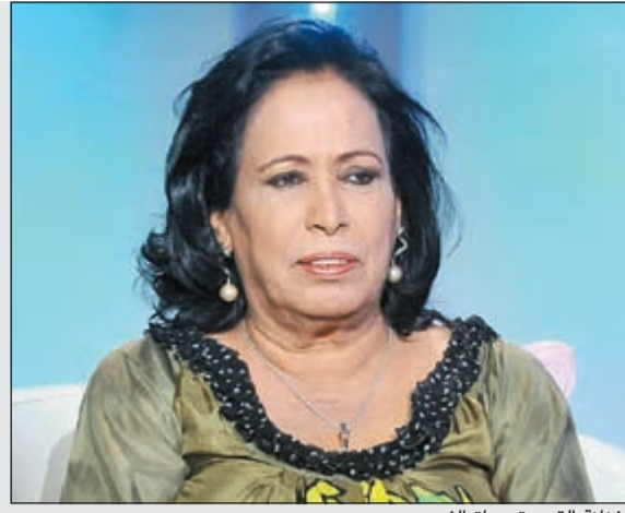
الفنانة القديرة حياة الفهد