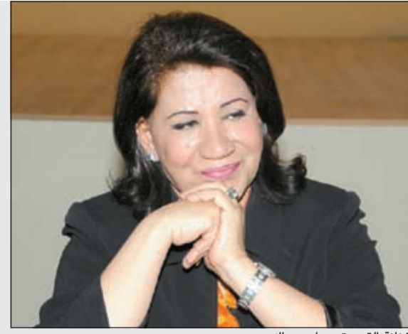
الفنانة القديرة سعاد عبدالله