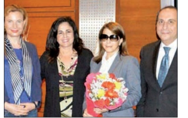
ماجدة الرومي مع منظمي الحفل في القاهرة

ويعد هذا الحفل الذي سيجري الأحد المقبل على