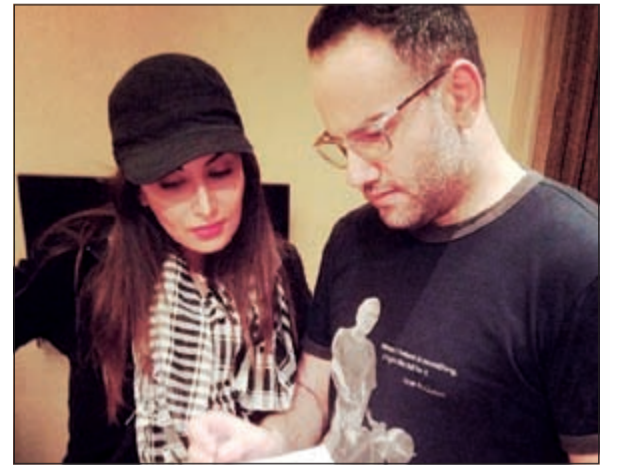
رويدا عطية مع سليم عساف

نشرت الفنانة السورية رويدا عطية عبر صفحتها على موقع «إنستغرام» صورة تجمعها مع الشاعر والموسيقي سليم عساف، مشيرة إلى تعاون فني جديد سيجع بينهما في القريب العاجل، وقد وصفت رويدا لقاءها مع سليم بالحرب،