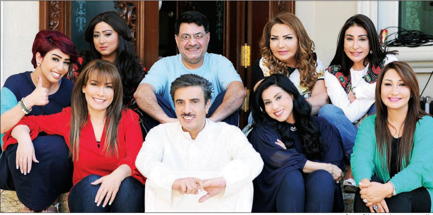
احلام مع فريق مسلسل «منطقة محرمة»