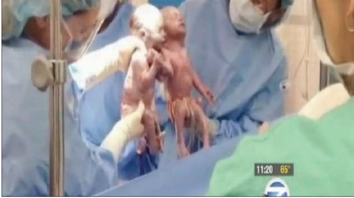
الطفلة تخرج من بطن الأم ممسكة بيد أختها التوأم

أنهما كانتا في كيس واحد وعلى تماس متواصل طوال الحمل. وقد فرضت تلك الحالة النادرة على الأم البقاء ممددة في سريرها لأسابيع طويلة، كما ظل التوأمين مراقبين لشهرين متواصلين، خشية أن يلف الحبل السري لكل طفلة على عنق الأخرى.