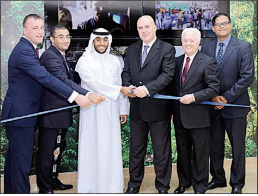
قصر شريط الافتتاح