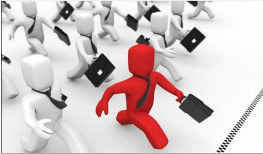
شركات الأوفشور الملاذ الآمن الجديد للتهرب من معدلات الضرائب المرتفعة

نظرا لما تقدمه هذه الشركات من الملاذات الآمنة ومرمات وقنوات تتيج فرص التهرب من معدلات الضرائب المرتفعة والانقاف على الضوابط