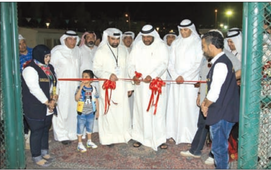
الشيخ احمد المنصور يقص شريط افتتاح البطولة

أحمد الخزعزل ونائب المدير العام الدكتور جاسم الهويدي وعدد من مسؤولي الهيئة. وجاء حفل الافتتاح لافتاً ومميزاً بدأ بالسلم الوطني وإطلاق للألعاب النارية، وعلى هامش افتتاح البطولة قام الشيخ أحمد المنصور بفتح الملعب الثاني بساحة بيان والمخصص لقطاع البراعم ومعرضاً للتوعية الصحية بمشاركة وزارة الصحة وإدارة الطب الرياضي التابعة للهيئة.