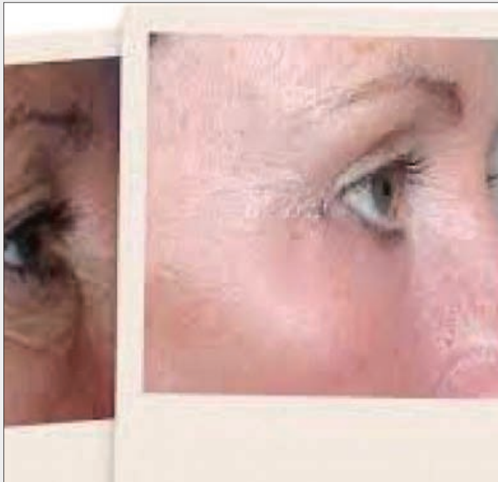
حقن البلازما تصيب البشرة ببعض الاحمرار

الكاربوكسي يعالج تشققات الجلد وارتخاه فهو يقلل السلوليت الذي فشلت عدة تقنيات في القضاء عليه يمكن استخدام البلازما الغنية بالصفائح الدموية بوضعها في الجلد لتحسين أنسجة الجلد والبشرة ومعالجة التجاعيد