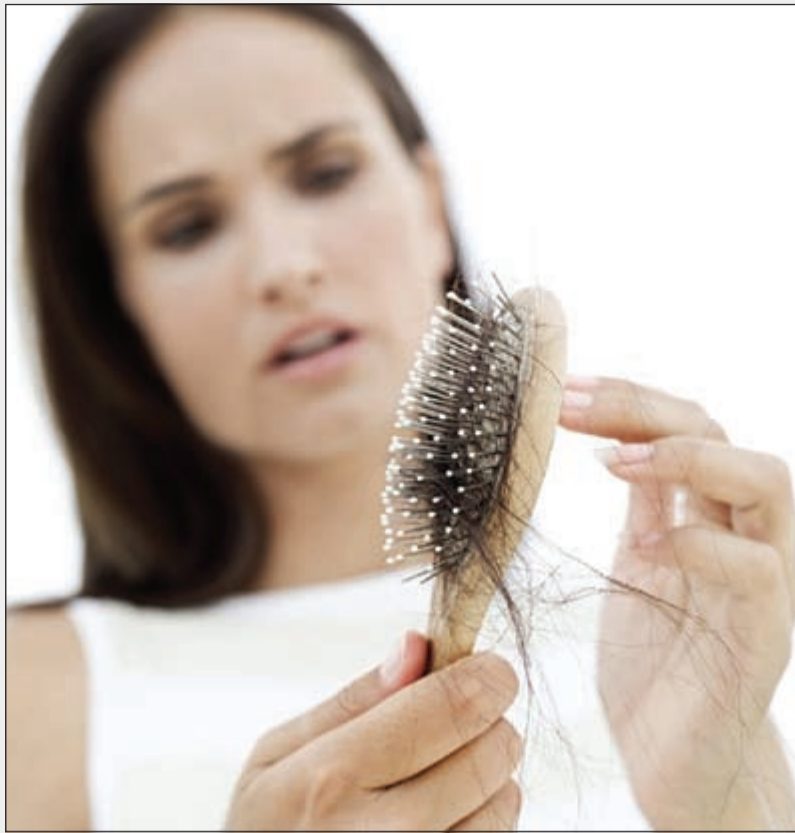
الكاربوكسي يعالج تساقط الشعر

يستخلص من دم المريض نفسه يتم حقن المنطقة بغاز ثاني أكسيد الكربون ما يؤدي إلى طرد الاحتقان والسموم من الأنسجة