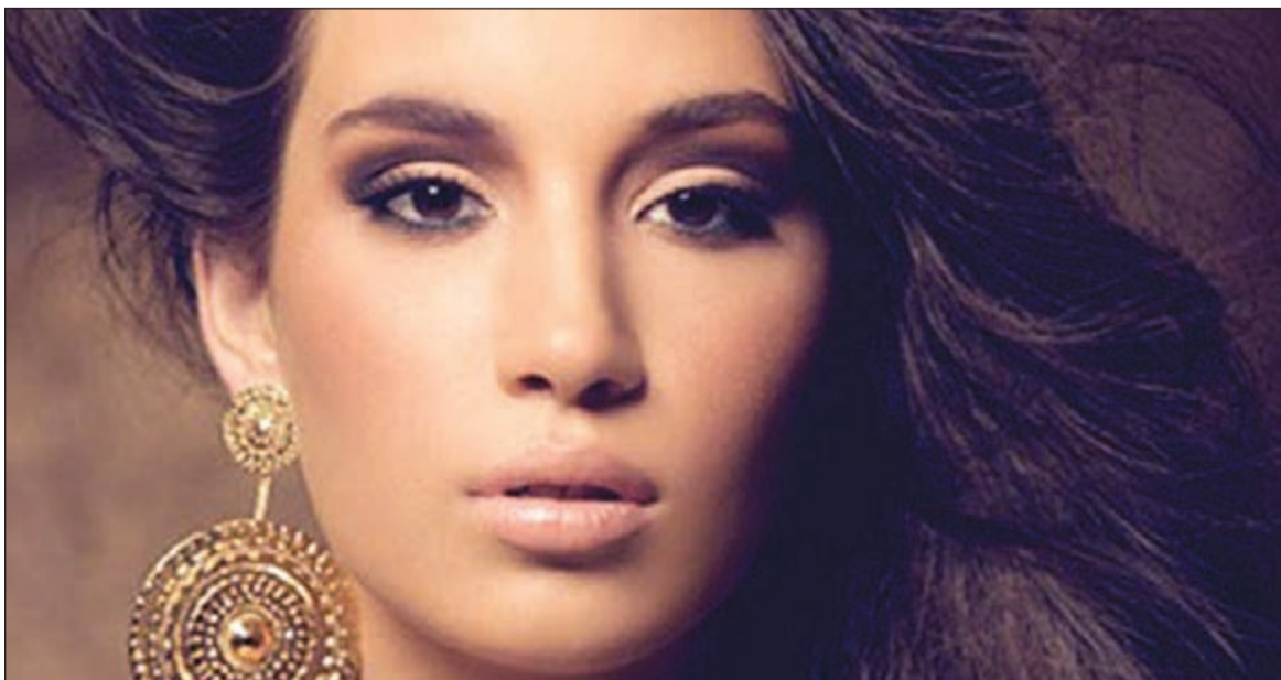
تأثير البلازما يكون أقوى كلما قل العمر

هل يعتبر العلاج بتقنية البلازما الغنية بالصفائح الدموية آمناً؟ ● نعم بالطبع فنحن نستخدم