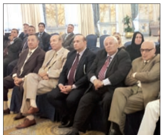
جانب من أبناء الجالية المصرية خلال اللقاء

وحول زيادة عدد مقاعد الجامعة لأبناء المصريين في الخارج، حيث إن نسبة الـ 5% لا تكفي بعد تضاعف الأعداد في السنوات الماضية، وعد أبوالنصر الحضور بعرض فكرة زيادة المقاعد الجامعية لأبناء المصريين العاملين في الخارج في اجتماع المجلس الأعلى للجامعات القادم، كما تبني فكرة فتح فرع لجامعة القاهرة في الكويت، مطالبا الحضور بتقديم طلبا مكتوبا سيرضه على رئيس الجامعة د.جابر نصار، كاشفا للحضور أن تنسيق الجامعات العام المقبل سيكون إلكترونيا بالكامل.