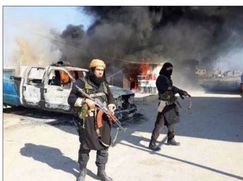
صورة أرشيفية لعناصر من تنظيم دولة الإسلام في العراق والشام في الأنبار العراقية

بغداد - وكالات: قتل مسلحون مجهولون 20 جنديا عراقيا بالقرب من مقر عسكري قرب مدينة الموصل في شمال العراق، بحسبما أفادت مصادر أمنية وطبية مسؤولة أمس. وأوضحت المصادر أن المسلحين الذين لم يكن بالإمكان تحديد أعدادهم قاموا باقتحام المقر الواقع في قرية عين الجحش إلى الجنوب يختطفوا الجنود ويقوموا بقتلهم في مكان قريب بعد حوالي ساعة. وأعلن مصدر أمني عراقي أمس عن مقتل 10 عناصر من تنظيم دولة الإسلام في العراق والشام (داعش)، في اشتباكات مع القوات العراقية شرق الفلوجة.