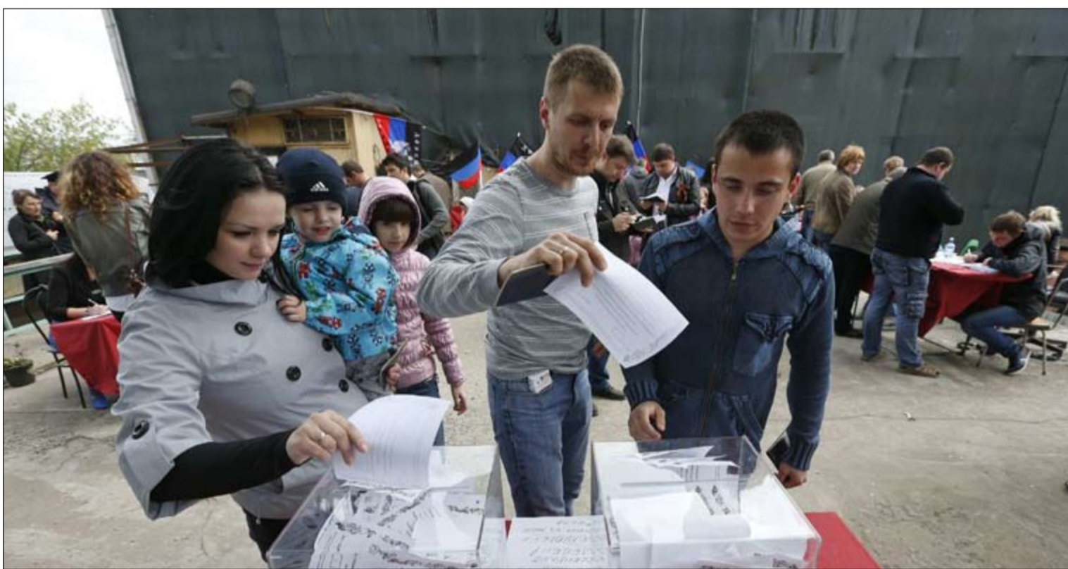
الأوكرانيون يقترعون خلال الاستفتاء على انفصال دونيتسك ولوغانسك أمس (رويترز)

في دونيتسك كبرى مدن المنطقة، الصقت أوراق كتب عليها كلمة استفتاء تحت علم «جمهورية دونيتسك» التي أعلنها المتمردون. وتبدو نتائج الاقتراع محسومة لكن نسبة المشاركة