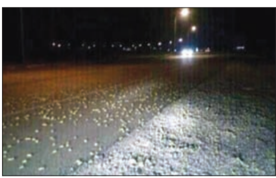
صورة تداولها مغردون أمس لما قيل انه أسراب جراد على طريق السالمي

من مصادر رسمية، قال العالم الفلكي د. صالح العجيري: لا تخافوا.. ان موجات أسراب الجراد المتوقع وصولها الى البلاد لن تكون كثيفة أو مخيفة، بل ستكون عادية جداً، وليست كموجات أسراب الجراد التي شهدتها البلاد في الثلاثينيات والأربعينيات والستينيات والثمانينيات من القرن الماضي، وأضاف العجيري: «أذكر في العام 1931 عندما غزت أسراب الجراد البلاد أن الموجة استمرت أكثر من 15 يوماً، وكانت أسراب الجراد تخفي الشمس وتقلب النهار ليلاً لكثافة أسراب الجراد، ويومها كنت صغيراً، وكان والدي يضع لي في سطح المنزل 4 تنكات، ويضع فوقها لوحاً خشبياً لكي أتأم عليها، وذلك حماية لي من (الدبا)..»