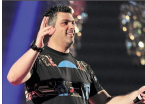
فارس كرم في الحفل

من جانب آخر، أكد مدير أعمال فارس كرم أن الفنان لم يقرر حتى الساعة ما إذا كان قد ألغى فكرة تصوير كليب من اليوم الذي قارب عمره الستين، مؤكدا أنه