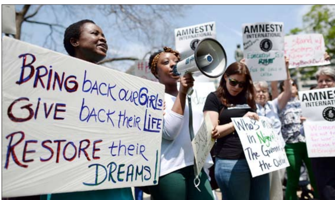
نشطاء بطالبون بعودة تلميذات نيجيريا المختطفات خلال مسيرة «العفو الدولية» في واشنطن امس الاول

في هذه الأثناء، نفى الجيش النيجيري ادعاءات منظمة العفو الدولية (أمستي انترناشونال) بأن السلطات النيجيرية تجاهلت تحذيرات باختطاف ما بين 200 و300 فتاة منذ أكثر من 3 أسابيع من داخل مدرسة ببلدة «شيبوك» بولاية «بورنو» شمال شرق البلاد على يد عناصر يعتقد أنها تابعة لجماعة بوكو حرام. وقال المتحدث العسكري كريس اولوكولادي أن السلطات الأمنية لم تتلق تحذيرات بخصوص اختطاف الفتيات، ولكنها تلقت تحذيرات بخصوص احتمال القيام بهجوم على دورية أمنية من قبل هذه الجماعة في نفس المنطقة.