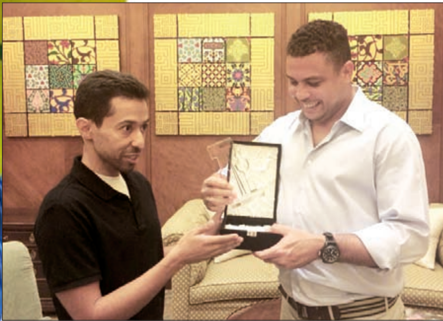
الحردان يقدم درعاً باسم نادي مشجعي مان يونايتد