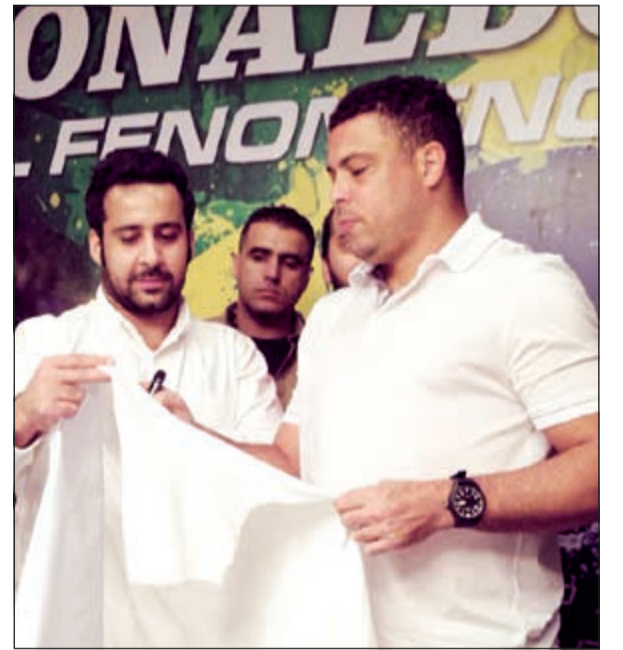
رونالدو يوقع على قميص ريال مدريد