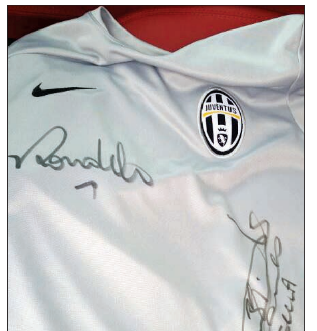
توقيع رونالدو يا «سادة»