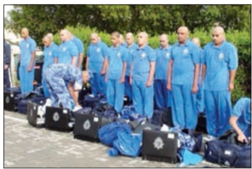
أبناء الكويتيات لدى التحاقهم بمدرسة الشرطة

بناء على تعليمات نائب رئيس مجلس الوزراء ووزير الداخلية الشيخ محمد الخالد والمتابعة الحثيثة من وكيل وزارة الداخلية الفريق سليمان الفهد يقبول أبناء الكويتيات من أزواج خليجيين في سلك الشرطة تم قبول 61 متطوعا من الدفعة الخامسة من أبناء الخليجيين لزواج كويتيات برتبة شرطي.