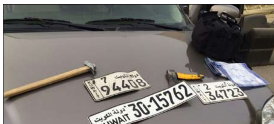
لوحات مسروقة وساطور من بين المضيوبات

المركبة متوقفة أمام بناية في الأندلس، وأفاد شهود عيان بأن شخصا من أصل انثين كانا في المركبة دخل إلى البناية وعليه تم الدخول إلى البناية وضبط الهارب وبالتحقيق معه قال إن زميله الذي هرب إلى جهة غير معلومة يدعى (ب.م).