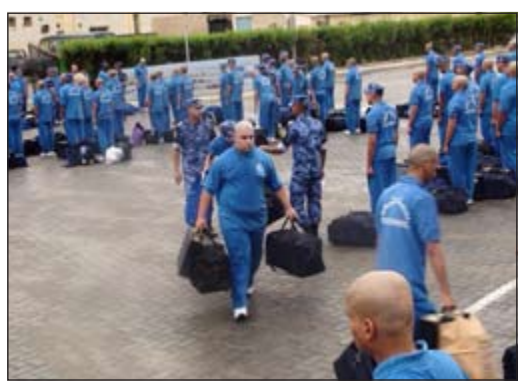
.. التحقوا بالدفعة الخامسة

وتتمثل هذه الدفعة الجزء المتبقى من دفعات سابقة تم قبولها في مدرسة الشرطة وتساهم في سد العجز في القوة الأمنية. ويخترط المقبولون في دورات نظرية وعملية لمدة 4 أشهر تتناول مواد قانونية وشرطة ومواد عامة بالإضافة إلى التدريبات العسكرية والرياضية تحت إشراف ضباط مدرسة الشرطة. حيث يتم توزيعهم بعد التخرج على مختلف قطاعات وزارة الداخلية لينضموا إلى زملائهم للقيام بالمهام الأمنية التي تطلب منهم. ويأتي هذا التوجه في إطار اهتمامات نائب رئيس مجلس الوزراء ووزير الداخلية الشيخ محمد الخالد بهذا الشأن وضمن الدور الإنساني والاجتماعي المستمر لوزارة الداخلية في التأكيد على ما يتمتع به أبناء الخليج من اهتمام وتواصل ولتسهيل انضمامهم إلى السلك الشرطي، حيث يخدم هذا التوجه شريحة كبيرة من أبناء دول مجلس التعاون لدول الخليج العربية بالإضافة إلى دعم أواصر الترابط بين الأشقاء وستساهم هذه الدفعة في سد النقص بالعنصر البشري بوزارة الداخلية وتمثل إضافة إلى الدفعات التي سبق قبولها.