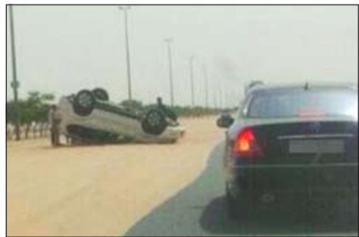
السيارة التي كان بها المسعفان بعد انقلابها