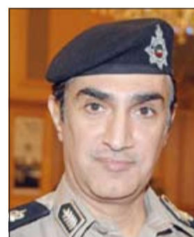
اللواء إبراهيم الطراح

وكانت النيابة العامة أخضعت الأم وابنها لتحقيقات مكثفة وذلك بعد ان وصل اليها تقرير الطب الشرعي والذي تضمن تعرض الخادمة من مواليد 1977 إلى ضرب مبرح وكدمات في الرأس نتيجة جسم