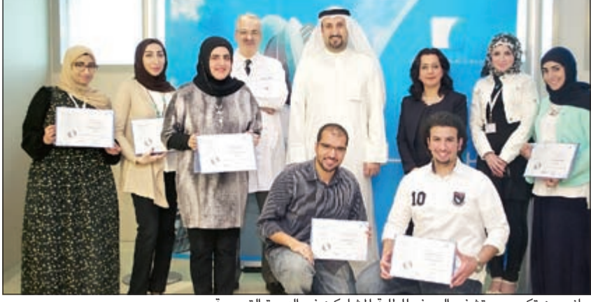
جانب من تكريم مستشفى السيف للطلبة المشاركين في الدورة التدريبية

في المرتبة الأولى والالتزام بالمبادئ الأخلاقية والتحلي بالصدق والشفاقة والعدل لكسب الثقة، والسعي للتميز والجودة العالية من خلال الإبداع والابتكار، ومعاملة المرضى والأسر بعطف واحترام وبسبب روح الفريق والتعاون من خلال العمل معا لضمان تبادل المعرفة والحكمة لمصلحة الجميع من جهتهم، عبر الطلبة المشاركين عن شكرهم وامتنانهم لمستشفى السيف الذي أتاح لهم هذه الدورة التدريبية وأشادوا بحسن تنظيمها، وثمنوا عاليا المعلومات والخبرات القيمة التي اطلعوا عليها. وقد تم في ختام الدورة تكريم الطلبة من قبل إدارة المستشفى التي حضت الطلبة على مواصلة الاهتمام بالمستوى العلمي وتطوير خبراتهم العملية.