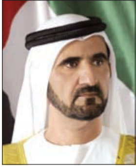
الشيخ محمد بن راشد

من خلال الاهتمام باختيار الدقيق للمواضيع المطروحة وكذلك المتحدثين، مشيرة إلى أن النقاش سيعني بإثارة تساؤلات تدور في رؤوس الكثيرين من المعنيين بالإعلام بهدف الوصول إلى توضيحات وأجوبة عن أبرز القضايا الإعلامية الراهنة على الساحتين العربية والدولية. وأعربت رئيس اللجنة التنظيمية لمنتدى الإعلام العربي عن سعادتها بالحضور القوي الذي ما يلبث أن يميز المنتدى عما تلو الآخر بمشاركة كوكبة من أبرز الأسماء من خبراء ومتخصصين يساهمون بأفكارهم ورؤاهم وإنتاجهم الفري والمتميز في تشكيل ملامح الأفق الإعلامي في المنطقة، حيث يمنح هذا الحضور زخماً قوياً للمنتدى ويؤكد قدرته على المشاركة بدور فاعل ومؤثر في تطوير المشهد الإعلامي عبر نقاش مستثير وواع يخضع معطيات الواقع للبحث والتحليل ويدعم قدرة القارئ على الإعلام لوضع تصورات واضحة لما يلزم تبنيه من خطط التطوير خلال المرحلة المقبلة وعلى جميع المستويات المهنية والتقنية.