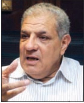
م. إبراهيم محلب