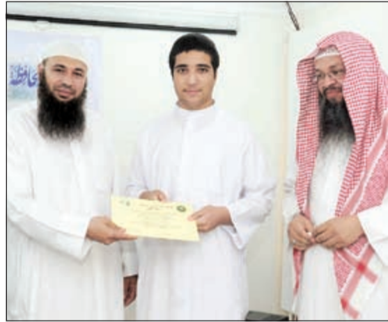
فائز يتسلم شهادته