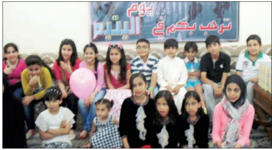
عدد من الأطفال المشاركين في الاحتفال

أو التعبير عن نفسه بقرأة آيات قرآنية أو حديث شريف. كما قامت إحدى الكافلات بتوفير عشاء خفيف لجميع الحضور، في جو من الأسرية والدفء. وقال رئيس جمعية الإصلاح الاجتماعي - فرع محافظة الأحمدى حمد الكندري إن مشروع كافلة الأيتام والذي يتفرع منه نشاط الحفل هو من أهم مشاريع لجنة زكاة إصلاح الأحمدى، إذ إن الطفل اليتيم فروة يجب استثمارها من خلال تعهدها بالتربية والرعاية، داعياً الكرام من أبناء الكويت إلى دعم المشروع والمشاركة إلى تحصيل الأجر العظيم من الله والإسهام في فضيلة التكافل والتراحم بين أبناء المجتمع.