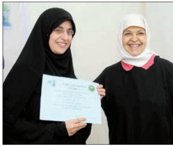
..وتسلم إحدى المكرمات شهادتها (أسامة ابوعلوية)

نظمت لجنة زكاة الرقة وهدية التابعة لجمعية الإصلاح الاجتماعي - فرع محافظة الأحمدى حفلها الأول تحت عنوان «يوم اليتيم»، وذلك بمقر فرع الجمعية بالرقة، وقد قام بالاستضافة كل من مشرفات الجمعية وكافلات الأيتام. وكان ضمن المصنف المستهدف الذي تم خلال الحفل أن يلتقي الأطفال والكافلات ليحدث نوع من التفاعل بينهم، من منطلق أن العلاقة بين الكافل واليتيم علاقة إنسانية راقية كعلاقة الأم بابنائها. وقامت الكافلات الكريمة بعمل برنامج ترفيهي للأطفال من خلال الألعاب والمسابقات وإتاحة الفرصة للأطفال ليقوم كل منهم بممارسة موهبته