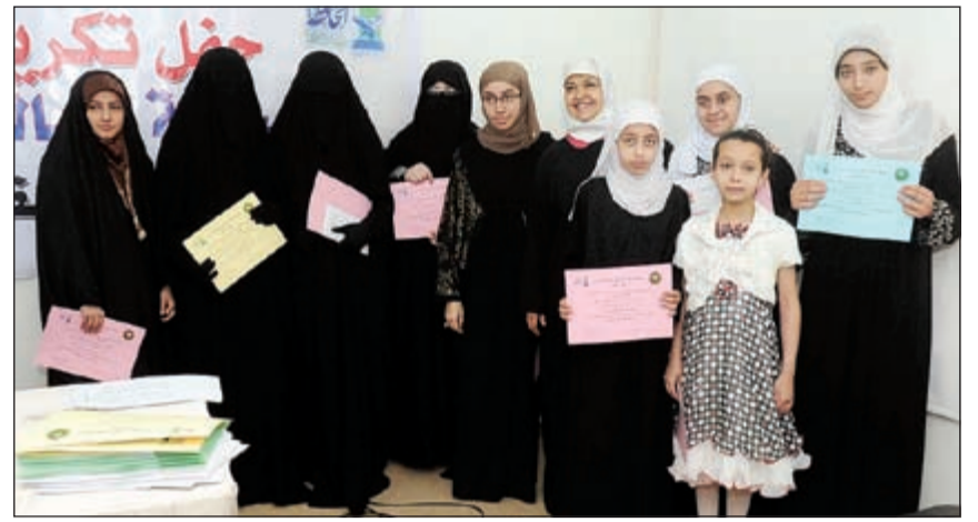
نسبية المطوع مع عدد من المكرمات