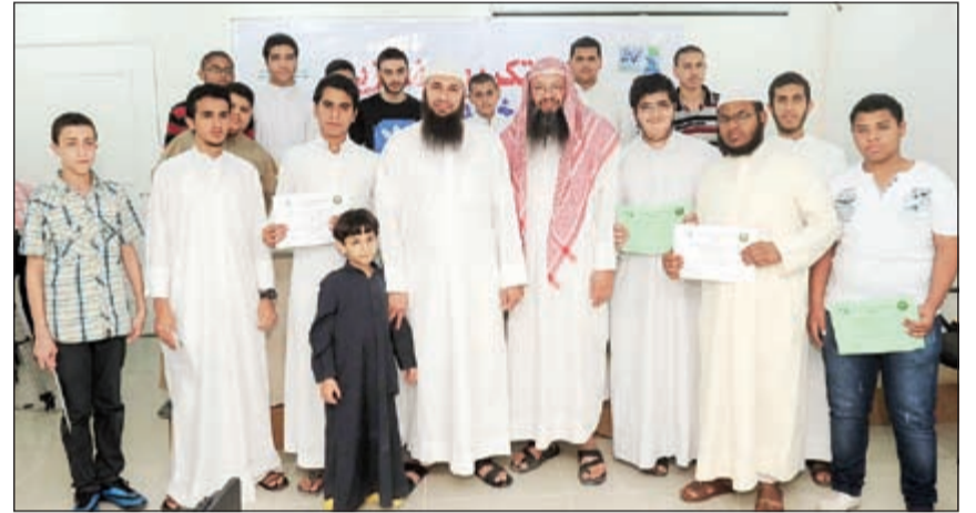
صورة تذكارية لعدد من حفظة كتاب الله

المسابقة حتى نرعى حفظة كتاب الله كاملاً. وقال منظم المسابقة الشيخ الهيثم الصادق، كلما قرأ المسلم القرآن اعتلى مرتبة علياً في الدنيا والآخرة ومن اعتصم بالله وذكره كان له القدر المعلى في الدنيا والآخرة، وأهل القرآن هم أهل الله، عن أنس رضي الله عنه قال: قال رسول الله ﷺ «إن لله تعالى أهلين من الناس قالوا: يا رسول الله من هم؟ قال: هم أهل القرآن سعداء بكم ونشكر القائمين على المسابقة الشريفة المصنف وقام مشيرة جوهر والشيخة سامية. وأبدت المطوع سعادتها بهذه الكوكبة وقالت: نحن سعداء بكم ونشكر القائمين على المسابقة الشريفة المصنف، ونشكر عائلة المحري لرعايتهم للمسابقة ونسأل الله أن يثبت كل من ساهم في