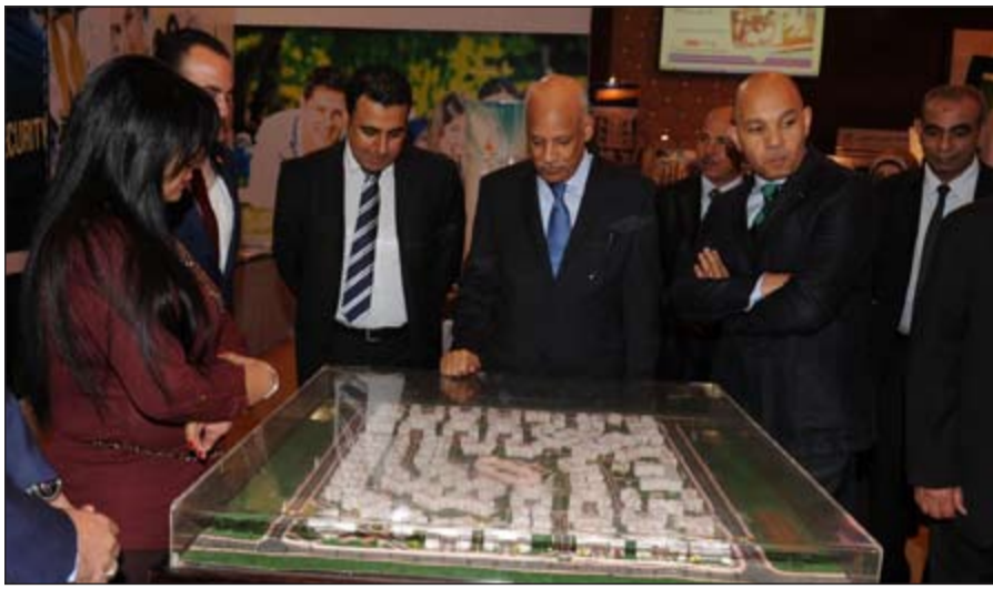
السفير المصري يطالع مجسم مشروع عقاري لحدى الشركات

أعلن الأمين العام للمنظمة العربية الأوروبية للبيئة بجنيف ورئيس بنك التنمية البيئي في أبو ظبي د. طارق بن عبد الاتفاق مع اتحاد المستثمرين العرب على إقامة أكبر مشروع اقتصادي تنموي في محافظة سيناء باستثمارات تبلغ 800 مليون دولار يتضمن إقامة مدينة عالمية للخدمات المتكاملة من مشروعات طاقة نظيفة والسياحة العلاجية على مساحة 70 ألف متر مربع. وقال بن عبيد في تصريحات لـ «الأنباء» على هامش مؤتمر صحافي عقد بمقر الاتحاد ان المشروع يتم تمويله باستثمارات خليجية - روسية - عربية ويستهدف توفير الخدمات البيئية للمنطقة كما سيتم تشغيل المشروع الجديد من خلال إقامة مشروعات للطاقة الجديدة والمتجددة المعتمدة على الطاقة الشمسية لتطبيق اشتراطات الاقتصاد الأخضر. ومن جانبها أكدت رئيس اتحاد المستثمرين العرب هدى بيسي أن المشروع يأتي في إطار الدعم الخليجي للاقتصاد المصري وتفعيلاً لبروتوكول التعاون بين المنظمة والاتحاد الذي تم توقيعه خلال مؤتمر عيون موسى مؤخراً برعاية جامعة الدول العربية وإنشاء الاتحاد لمركز الدعم الفني للاقتصاد الأخضر.