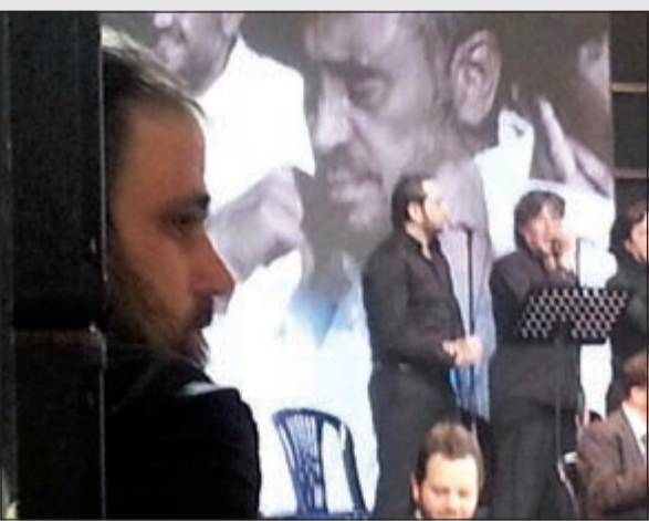
واديح ابن الوصف يراقب

فركض رجال الأمن لتطويق وحمله خارجا بالقوة، لكن أبو وديع أبدى انزعاجه وأمر بعدم التعرض له سأل ماذا يريد فأجاب: «أن أقبلك»، فأدخله المسرح وطلب منه تقبيله شرط أن يضع يده خلف كتفه، ولما فعل، قال أبو وديع ضاحكا: «هاي بوسة»، لكن عشق «السوفيون» تحول لدقائق لدى بعض منهم تمللما وغبضا، حيث لدى استمرحة «سلطان الطرب» بسبب الإرهاق، حصلت مشادات في كواليس البرنامج بسبب تدافع الحضور الكثيف الذي أتى لساعات من سورية ومحاولتهم دخول المسرح، ما استدعى تدخل رجال الأمن