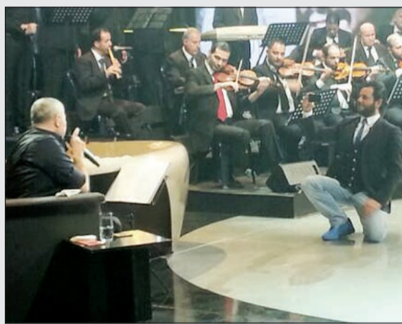
نيشان يلتقط صورة تذكارية لـ «سلطان الطرب»