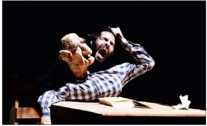
مشهد من مسرحية «راديكاليا»

وقد حددت اللجنة المنظمة لمهرجان المسرح الحر موعد عرض مسرحية «راديكاليا» التي تمثل الكويت في المسابقة