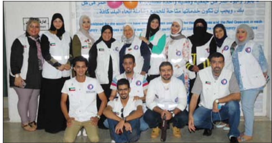
مجموعة من المتطوعين