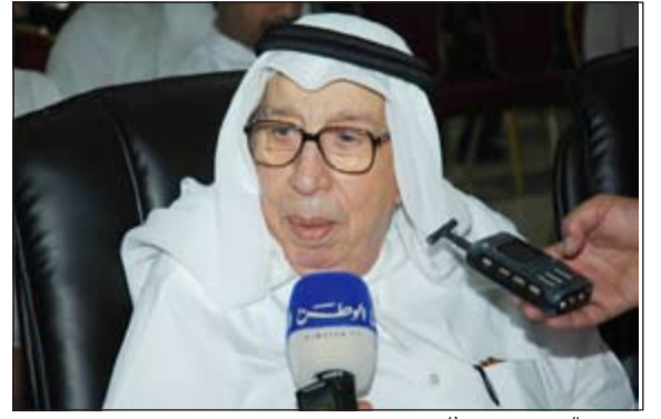
برجس البرجس متحدئا