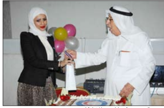
برجس البرجس مكرما احدى المشاركات

علمت «الأنباء» من مصادر صحية مطلعة أن وزارة الصحة تقوم حاليا بتحديث أجهزة الخادم الرئيسية في الوزارة «السيرفر» أو شبكة الإعلام الآلي لإضافة برامج حديثة ومتطورة لمواكبة الأنظمة الإلكترونية الجديدة. وأشارت المصادر ذاتها إلى أن تطوير وتحديث أجهزة الخادم الرئيسية