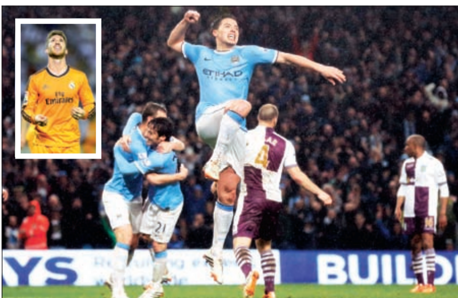
لقظة عالية من نصري تعبيراً عن اقتراب اللقب.. وفي الاطار راموس نجم ريال مدريد يحتفل بهدفه في «بلد الوليد»

«السيستيزنز» على أبواب استعادة لقب «البريميرليغ».. و«الملك» يودع «الليغا» منطقياً.. وسان جرمان «معرس» فرنسا