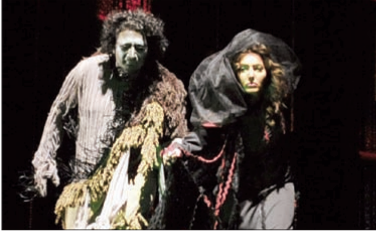
مشهد من مسرحية «من منهم هو»

في المسابقة الرسمية للمهرجان الخليجي، مشيرا الى ان المسرحية من إخراج خالد أمين وتأليف أحمد العوضي وبطولة أعلام حسن وفاطمة الصفي وعلي الحسيني وبدر البناي، وحسين الحداد، وعبدالله الزيد.