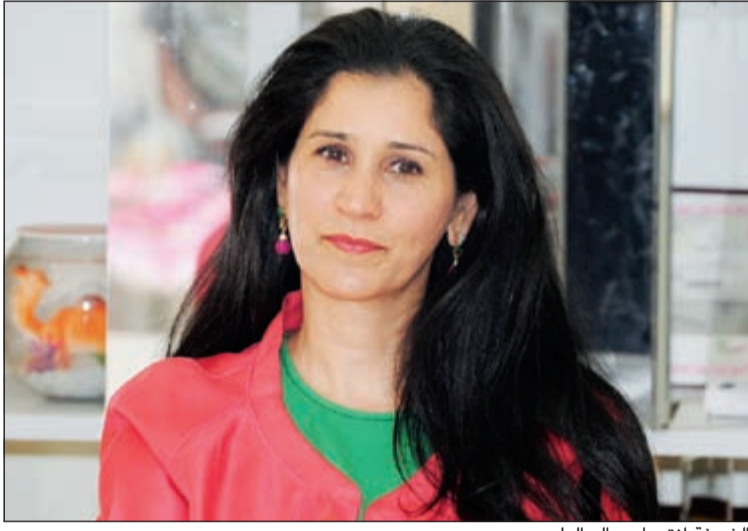
الشيخة انتصار سالم العلي

الجنسين: أن يكون لدى المتسابق قبول من النظرة الأولى ويكون متزنا ولديه الجرأة الكافية لتقديم أفضل ما لديه من أداء أمام لجنة التحكيم مع مراعاة سنوات خبرة المتقدم من قبل لجنة التحكيم، أن يكون صوت المتسابق ذا طبقة صوتية صحيحة وليست مزيفة، يجب أن يكون صوت المتسابق متقفا ولديه إلمام بالتراث والأغاني الحديثة، يجب أن يجيد المتسابق لفظ الأخراف والكلمات ومخارج الحروف واضحة، وعلى المتسابق أن يكون لديه صوت مميز وأداء متقن ويغني بشخصيته ولا يقلد أحد النجوم.