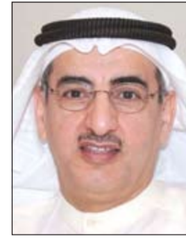
م. عبدالعزيز الإبراهيم

تحت رعاية وزير الكهرباء والماء ووزير الأشغال العامة م. عبدالعزيز الإبراهيم يقام المعرض والملتقى الكويتي الإماراتي الثاني والذي يقام بفندق ياس فابيسروي بأبوظبي الفترة من 12 إلى 15 مايو الجاري. إن العلاقات الكويتية الإماراتية علاقات أخوية قوية متينة بنيت على أسس عربية أصيلة تربط بينها الدين واللغة والعروبة فهما (الكويت والإمارات) نسج واحد على المستوى الخليجي والمستوى العربي، فإواصر التاريخ متصلة بينهما والترابط المشترك في شتى المجالات مما زاد هذا الترابط والتواصل. وعن هذا الملتقى يقول ملاك صبحي المدير العام للجهة المنظمة: إن هذا الملتقى يأتي ضمن سلسلة المعارض والملتقيات التي تنظمها سكاى