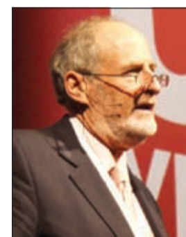
د. غاري ليفي

ورغم إجراء 112000 عملية زرع أعضاء صلبة سنوياً، إلا أن الطلب على ذلك أكثر من عدد الأعضاء المتوفرة، مما يزيد عدد المسجلين على قائمة انتظار الأعضاء والوفيات الناتجة عن طول الانتظار. يلاحظ غالباً أنه رغم نجاح عمليات الزرع وقلة المضاعفات الناتجة عن الجراحة، إلا أنه يجب تحسين استدامة فعالية العضو المزروع لبقاء المريض على قيد الحياة.