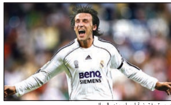
صورة مقترضة لبيرلو بزي الريال