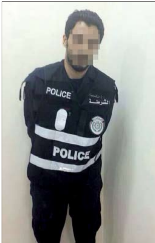
للص بزي ملازم أول