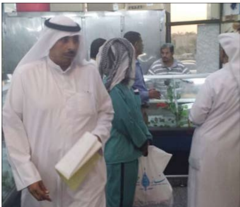
اللجنة الثلاثية تطلع على الأوراق الثبوتية والمنتجات الغذائية في احد محلات الجزارة

شنت اللجنة المشتركة بين وزارة الشؤون البلدية والتجارة حملة مفاجئة مساء امس الأول وأسفرت الحملة التي شهدتها محافظة العاصمة عن ضبط عدد من المخالفات وايضا تم ضبط اغذية وخضراوات ولحوم قاربت صلاحيتها على الانتهاء، وتم ضبط عمالة مخالفة لقانون الإقامة لتتم إحالة المضبوطات إلى جهة الاختصاص ورفع تقرير بالواقعة، كما أشار المصدر إلى ان الحملات ستزداد في الفترة المقبلة بشكل مفاجئ وعلى عموم المحافظات.