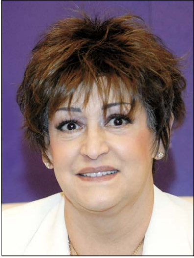
الفنانة الراحلة وردة