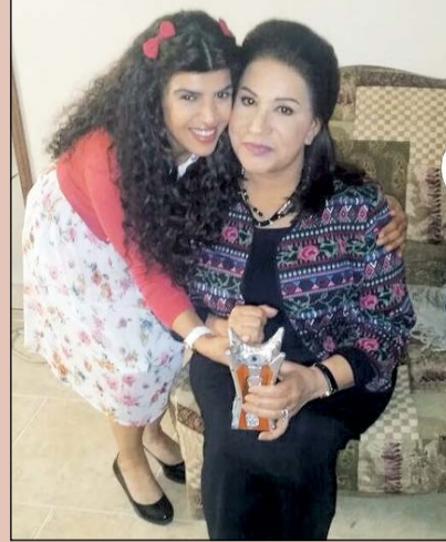
غدير في كواليس «ثريا» مع الفنانة القديرة سعاد عبدالله

أعمال راقية تحترم عقلية المشاهدين وتكون خالية من أي إسفاف أو ابتذال، فالدراما سلاح مهم لا بد من استغلاله لتوجيه الآخرين إلى الطريق الصحيح وتسلط الضوء على قضايانا وسبل علاجها، متمنية أن تكون دائماً عند حسن ظن الناس بها، واعدة بالتدقيق في اختياراتها بما يضيف لها كمنثلة.