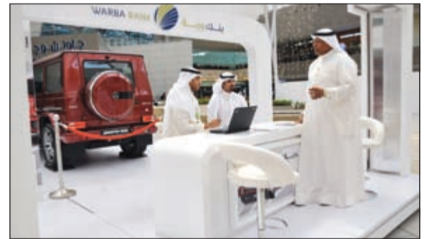
موظفو بنك وربة أثناء تواجدهم بجناح الحملة في الأقنيوز

وإختتم السالم بالقول: «سينتواجد موظفونا في جناح «وربة» في مجمع الأقنيوز، للتواصل مع العملاء ولإطلاعهم على آلية الاشتراك في السحب والرد على كل استفساراتهم حول الحملة».