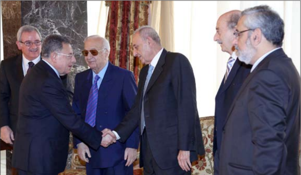
رئيس الحكومة السابق فؤاد السنيورة مصافحا رئيس البرلمان نبيه بري بحضور النواب وليد جنبلاط وهاغب وبقراونديان وميشال المر ووجان اوغاسابيان على هامش جلسة الحوار في بعيدا امس

واكد المجتمعون على ضرورة استمرار هيئة الحوار الوطني واستمرار السعي لتنفيذ مقررات الحوار لتجنيد لبنان التداعيات السلبية للامزمات الاقليمية، ومواصلة البحث في الاستراتيجية الدفاعية عن لبنان، وفق التصور الذي قدمه الرئيس سليمان واعتبر منطلقا للنقاش، والتأكيد على تطبيق اتوافق الطائف والتشجيع على مواصلة السعي لتطبيق خلاصات المجموعات الدولية لدعم لبنان وقواته المسلحة والسكالم والاجئين السوريين في لبنان والتشجيع على الاحترام الاستحقاقات الرئاسية والنيابية وتجنب الفراغ في الرئاسة الاولى من خلال تأمين النصاب لانتخاب رئيس جديد ضمن المهلة الدستورية واجراء