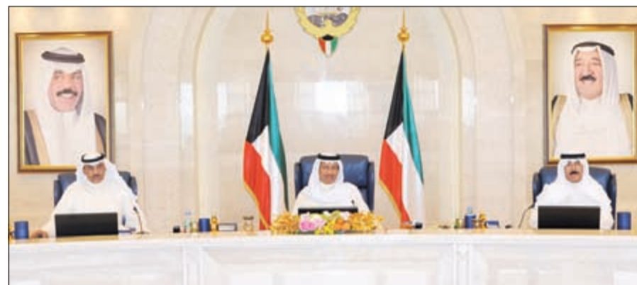
سمو الشيخ جابر المبارك مترشحا لجلسة مجلس الوزراء أمس ويتوسط الشيخ صباح الخالد والشيخ محمد الخالد

أعلنت مصادر رفيعة في تصريحات خاصة لـ «الأنباء» أنه بحسب لائحة مجلس الأمة سيتم التصويت على استقالات النواب في جلستي 13 و27 مايو الجاري، مستدركة بأنه سيتم أخذ رأي الخبراء الدستوريين في مدى