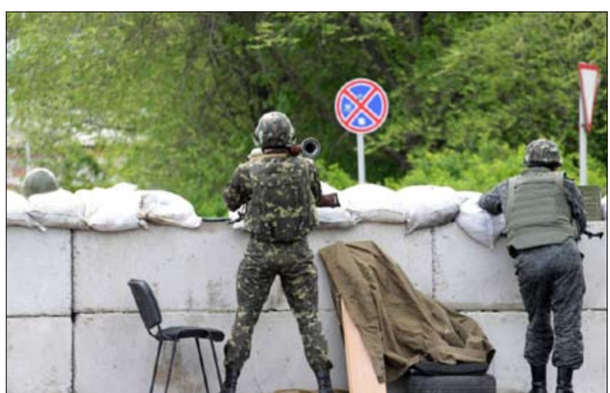
جنديان أوكرانيان يتخذان وضعية قتالية في مدينة سلافيانسك التي شهدت مواجهات عنيفة بين موالين ومعارضين لروسيا

موضحا أنه «لا يوجد حل عسكري، يجب أن يكون سياسيا». في المقابل، نكر انفصاليون مولون لروسيا أن ما يصل إلى 20 من مقاتليهم ربما يكونون قتلوا في اشتباكات مع القوات الحكومية في سلافيانسك.