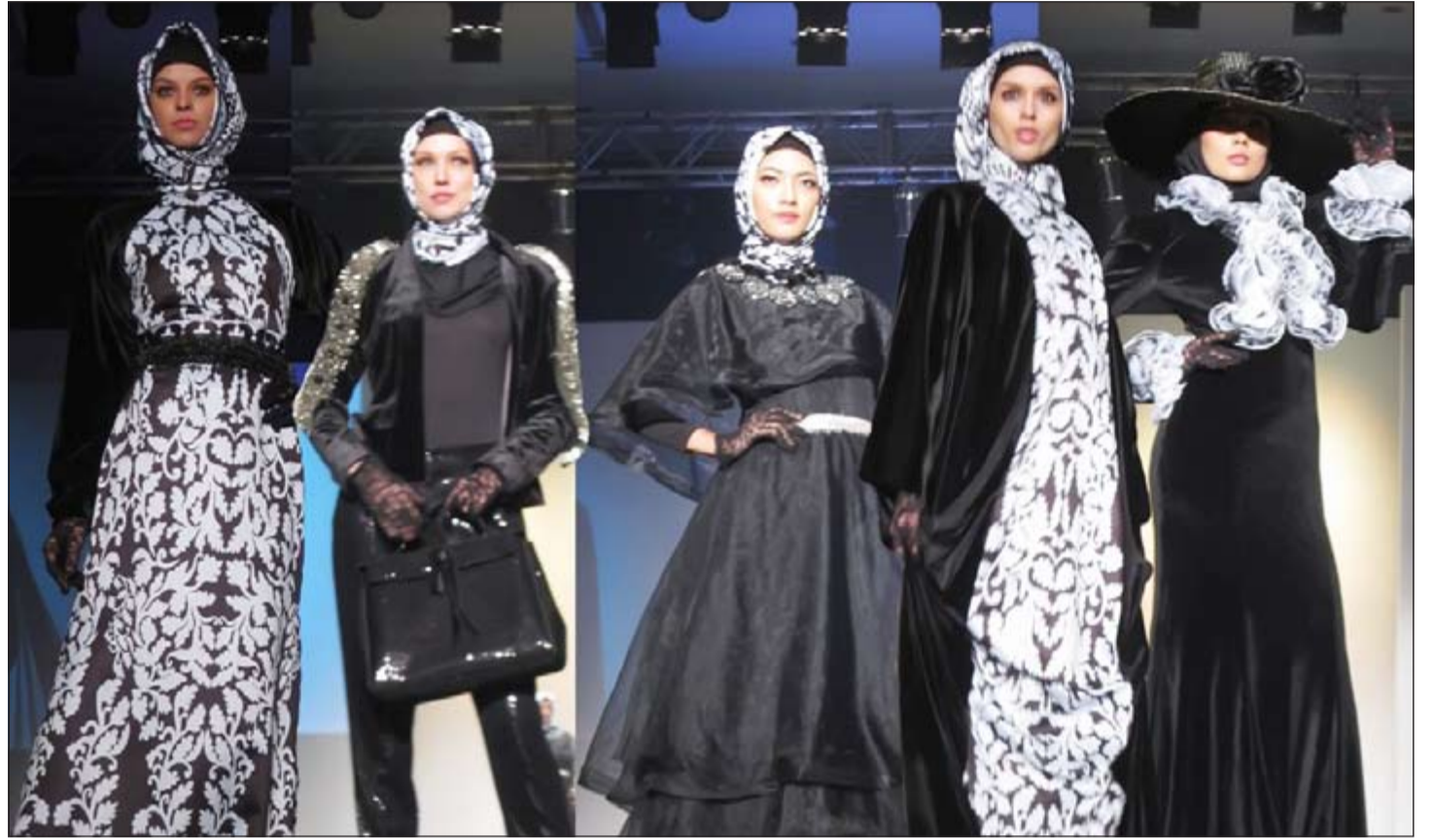
عروض أزياء إسلامية فاخرة تفتح فرصا لانطلاق صناعة مشرمة