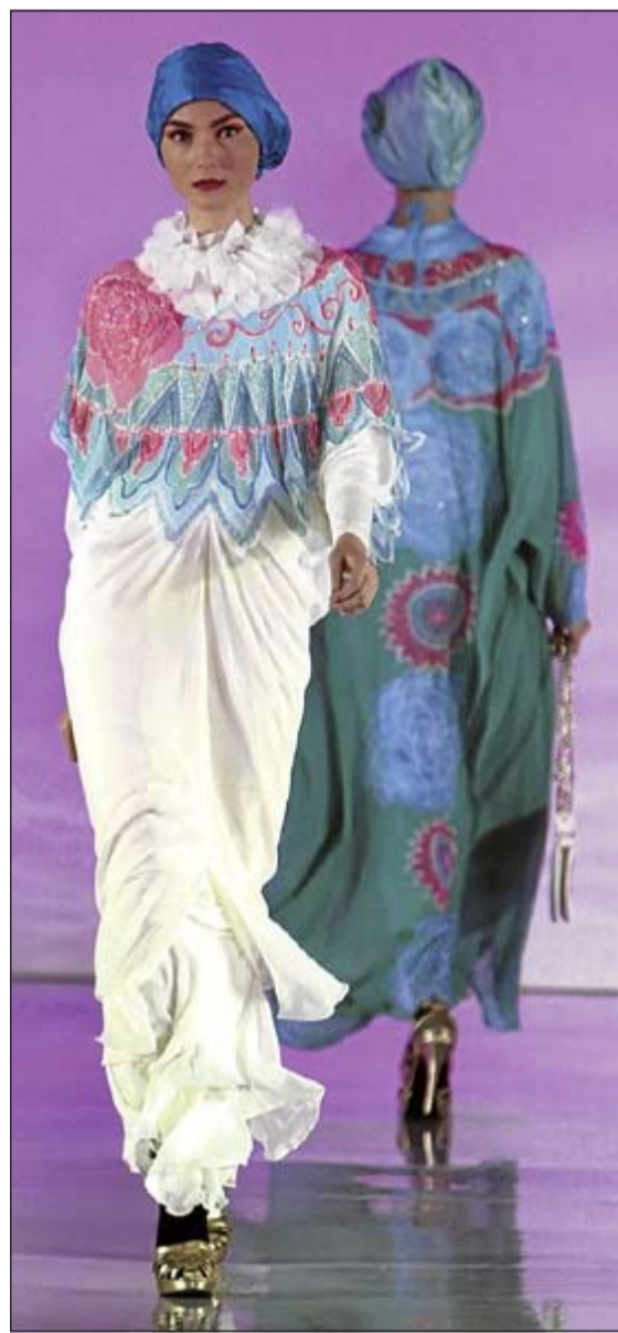
عروض الأزياء الإسلامية بانتظام، لكن الاهتمام بهذه الملابس لم يقتصر على بلاد المسلمين فقط، بل انتقل

من جهة أخرى، توفر أسواق الرياض ومراكزها التجارية تشكيلات متنوعة من العبااءات التي تلبى مختلف الأذواق بما فيها عبااءت بحوش ملونة. وفي مدينة جدة تتزاحم العبااء السوداء مع عبااءت خضراء وزرقاء غالبا ما تكون مزركشة وذات سحابات أمامية مستوحاة من الملابس الرياضية. وتستضيف كل من دبي وجاكرتا وكوالالمبور