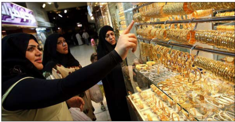
صورة أرشيفية لكويتيات يطالعن معرضا للذهب (أ.ب.)

نزول أسعار الذهب. وتحصل الكويت المرتبة الثالثة خليجيا بعد الإمارات العربية المتحدة التي تتبوأ المرتبة الأولى خليجيا في تجارة الذهب ويلبها سوق العربية السعودية وتسعى جاهدة إلى أن تتلحق ولو نسبيا بهذه الأسواق عبر الترويج بشغولتها من المعدن الأصفر من خلال المعارض. ويرى بعض المحللين وخبراء المعادن الثمينة والمجوهرات أن المشكلة التي تواجه تجارة الذهب في الكويت تمثل في وعي العميل في المنتج من حيث صعود ونزول أسعار الذهب ومتابعة حركة أسعاره.