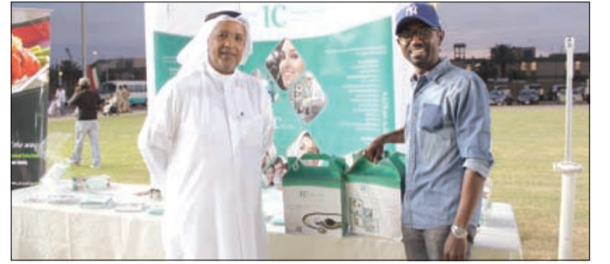
جانب من مشاركة «إنترناشيونال كلينك»

من جانبه، عبرت مديرة كادحي مؤسسات القطاع الخاص على توضع أهمية مشاركة القطاعات والهيئات والمؤسسات العامة وخاصة في مثل هذه الاحتفالات، لما تغفله من معان سامية تزيد أواصر الترابط الإنساني في المجتمع من خلال الاهتمام بهذه الفئة التي لها حق على المجتمع بأكمله. وأقيم الحفل في دور الرعاية الاجتماعية قسم الحضانة العائلية للأطفال، ودار الفتيان، ودار الفتيات، بهدف أنحال السعادة على جميع الفئات العمرية من الأيتام. وقدمت خلال الحفل العديد من الفقرات، وتضمن ذلك عددا من الفعاليات والبرامج وتم توزيع الجوائز والهدايا والألعاب، بدورها، قدمت إنترناشيونال كلينك العديد من الهدايا للأطفال الأيتام في محاولة منها لزرع الفرح في نفوسهم وساهمت في رعاية بعض الأنشطة.