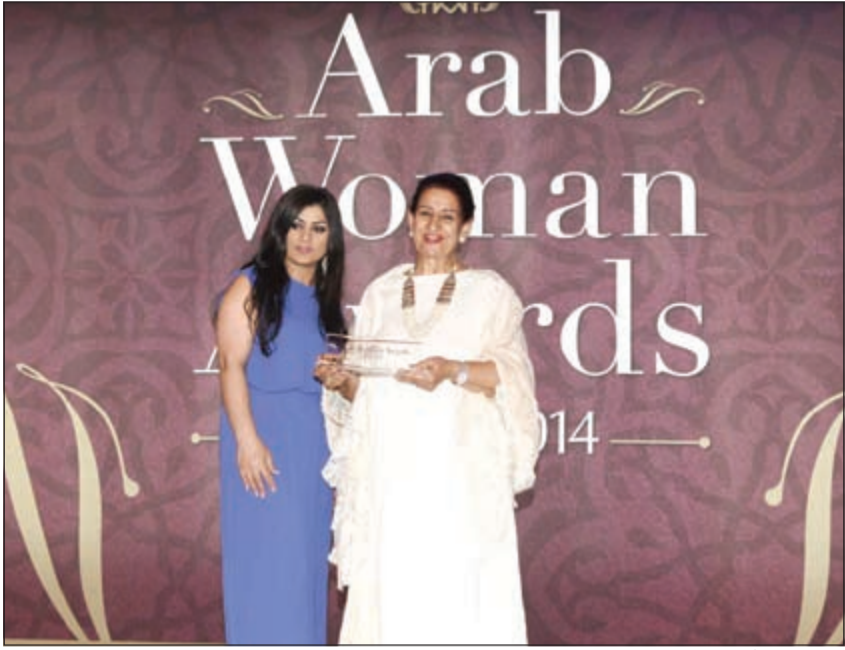
جائزة «المرأة الملهمة» للشبيخة شيخة العبدالله

تم تكريم الفائزات الـ17 بجوائز المرأة العربية في حفل لامع هدفه تكريم النساء العربيات الملهيات، والذي أقيم حصريا في فندق و أبراج شيراتون بتنظيم من الشركة الكويتية الرائدة «الطرف الأغر».