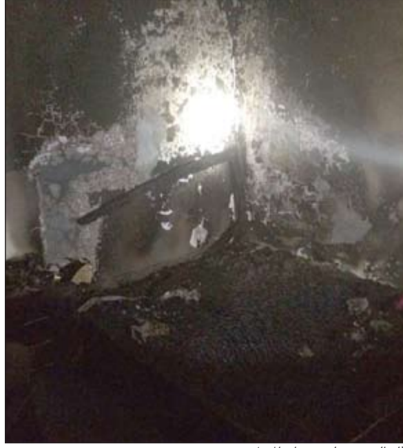
آثار الحريق على جذران المنزل