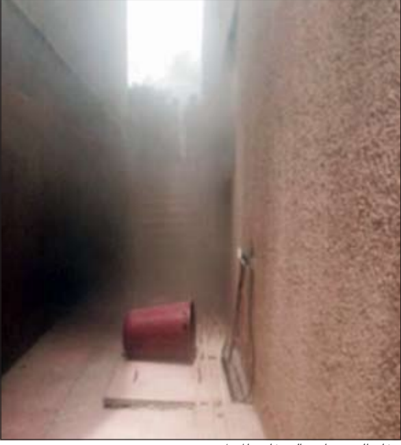
دخان الحريق امتد إلى خارج المنزل