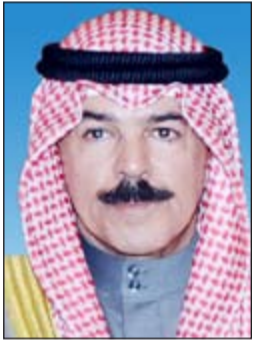
الشيخ محمد الخالد