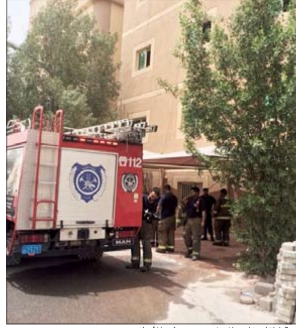
عربة إطفاء خارج المنزل حيث حدثت الحادثة