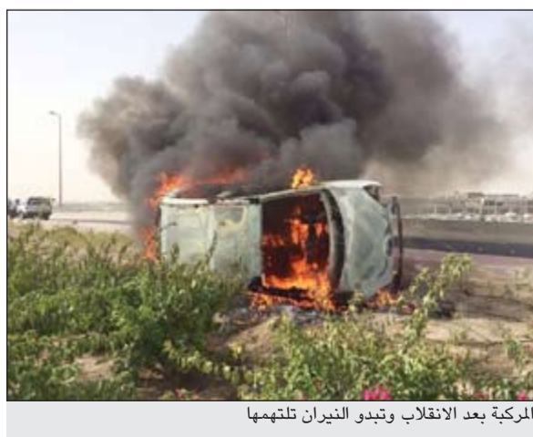
المركبة بعد الانقلاب وتبدو التياران لتلتهمها

للإطفاء تلقت بلاغا في الحادث مرعت للتعامل معه فرقة إطفاء مركز الفروانية بقيادة الرائد عبدالرحمن البصري، وفور وصول رجال الإطفاء للموقع تم إخماد السنة للهب وطلب الإسعاف للمواطن لفحصه احترازيا.