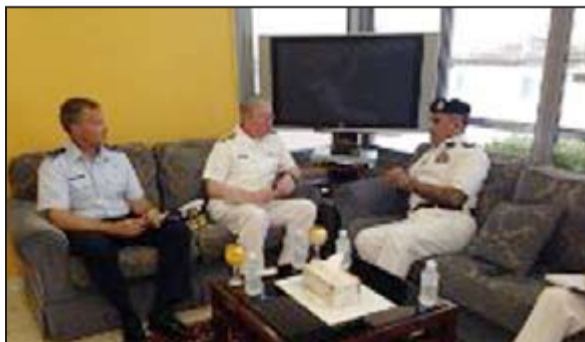
اللواء الشيخ محمد يوسف مستقبلا الاميرال ميلير

ميلير سبل التعاون والتنسيق المشترك والوقوف على أهم نتائج التمارين والمناورات التي تمت بين الطرفين خلال الفترة الماضية. كما أعرب اللواء يوسف عن سعاده بهذه النتائج، مؤكدا ضرورة تبادل الخبرات والمعلومات في هذا الشأن لاكتساب المهارات العملية في فنون التعامل البحري.