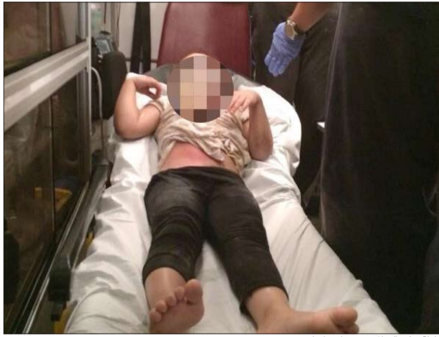
الطفلة نقلت إلى المستشفى احترازيا