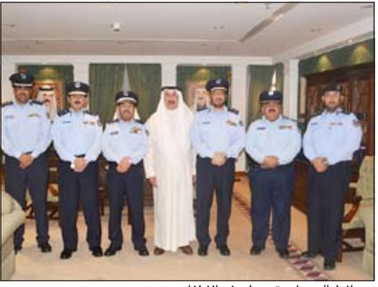
محافظ الجهراء يتوسط وفد الإطفاء