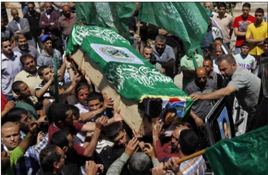
فلسطينيون يشيعون رفات عنصرين من حماس قضي عام 1998 خلال مراسم برام الله امس الاول

عواصم - الأناضول: رحب وزير الأوقاف والشؤون الدينية الفلسطيني محمود الهباش بفتوى تسمح للمسلمين من جنسيات بلدان خارج العالم الإسلامي، وعددهم حوالي 450 مليون مسلم، بزيارة المسجد الأقصى.