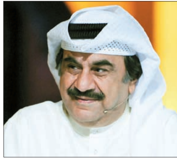
العلاق عبدالحسين عبدالرضا

المشاركة تعد محض فخر واعتزاز له وللنجوم المشاركين في العمل لتواجدهم بالقرب من الهرم الفني عبدالحسين