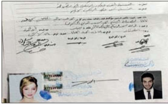
وثيقة الزواج التي انتشرت عن زواج بسمة وصويص