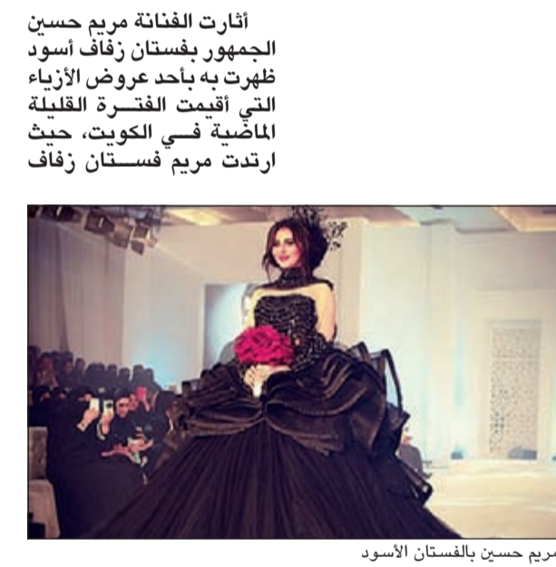
مريم حسين بالفستان الأسود

أثارت الفنانة مريم حسين الجمهور بفستان زفاف أسود ظهرت به بأحد عروض الأزياء التي أقيمت الفكرة القليلة الماضية في الكويت، حيث ارتدت مريم فستان زفاف