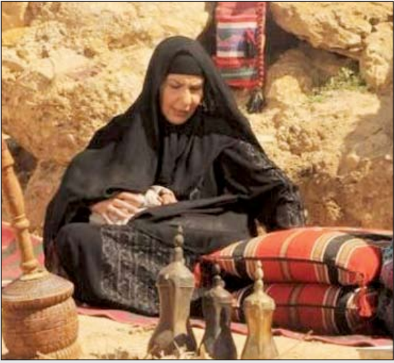
مشهد من «الوعد»