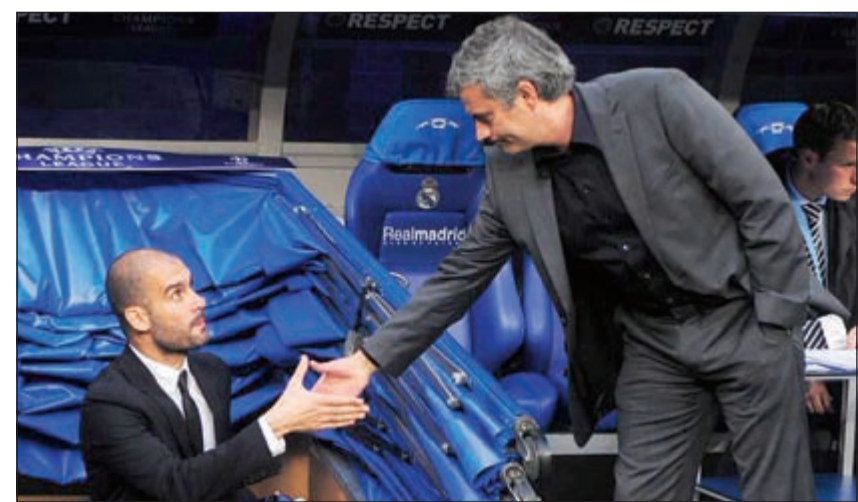
جماهير برشلونة تعتمد على مورينيو بعد أن خذله غوارديولا لإيقاف «الملك»

مورينيو كان دائم الدخول في شد وجذب مع جماهير المتنافس - برشلونة - حينما كان مدربا للريال، وكثيرا ما كان يصطدم بالصحافة الكتالونية. وكانت الجماهير بل والصحافة الكتالونية تعول كثيرا على بيب جوارديولا المدير الفني السابق لبرشلونة والحالي لباييرن ميونخ في أن يطيح بالبايرن، خاصة أن الأجواء في الأوساط البافارية كانت تهيب لذلك من خلال التصريحات السابقة للمباراة، إلا أن أحدا لم يتوقع أن يتلقى جوارديولا وفريقه ضربة موجعة بتلك الخسارة