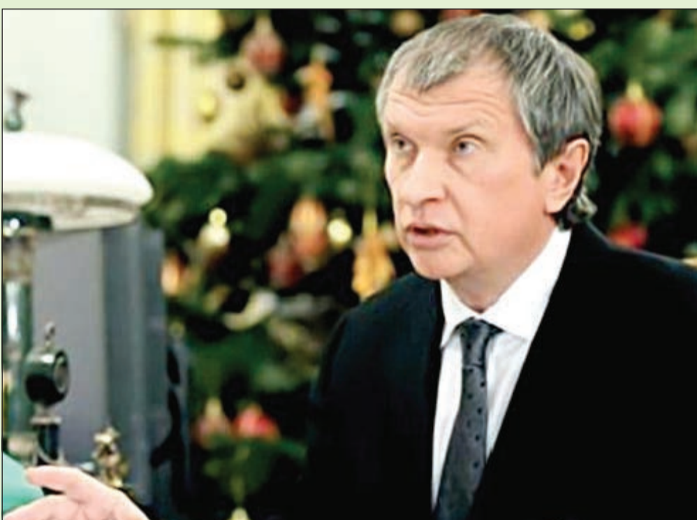
المراردير الروسي إيفور سيكين يواجه أزمة مالية بعد العقوبات الأميركية على اصقاء الرئيس بوتين الأترياء.. يذكر ان إيفور يهيمين