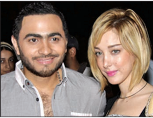
تامر حسني وبسمة بوسيلة

أكد مصدر مقرب من النجم المصري تامر حسني، انفصاله عن زوجته المغربية بسمة بوسيلة دون معرفة الأسباب الحقيقية التي أدت إلى هذا الطلاق الذي سيشكل صدمة لجمهوره. ونقل المصدر عن تامر أن الانفصال جاء بشكل مفاجئ وفي هدوء تام بعد أن اتفق كلاهما على ذلك، مؤكدا استمرار علاقة الصداقة والود والاحترام المتبادل بينهما. وكان تامر قد أعلن زواجه منذ عام تقريبا، وخلال هذه الفترة طالتهما مرارا شائعات الانفصال إلا أن تامر دائما ما كان ينفيها. والأفت أن «نجم الجيل» كان قد أعلن عبر صفحته الرسمية على «فيسبوك» قبل يومين أنه سينتقل إلى منزله الجديد