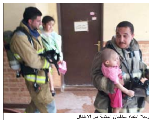
رجلا اطفاء يخلجان البناية من الاطفال