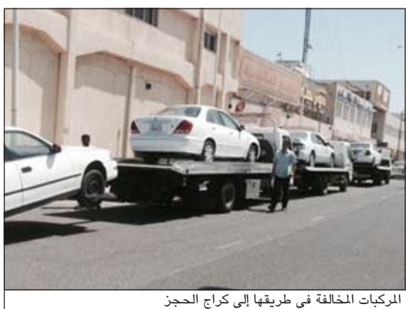
المركبات المخالفة في طريقها إلى كراج الحجز

أسفرت حملة مرور الفروانية في منطقة الضجيج يوم أمس عن تحرير 125 مخالفة مباشرة و100 مخالفة غير مباشرة، كما تم حجز 22 مركبة في كراج الحجز، من جهة أخرى أسفرت حملة مرور مبارك الكبير في منطقة صباحان عند تحرير 80 مخالفة وحجز 21 مركبة.