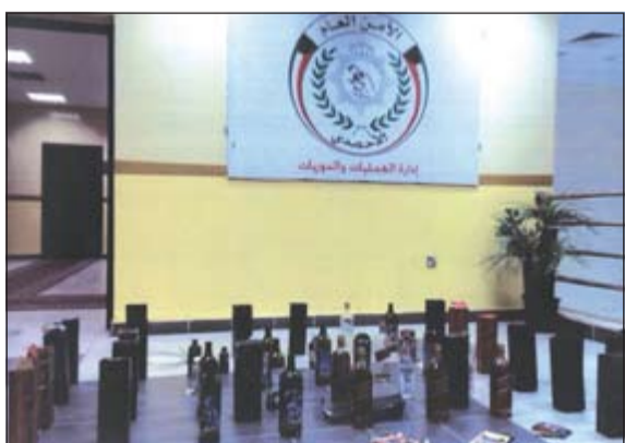
جانب من مضيوبات حملة الاحمدى