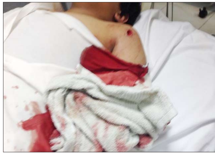
آثار الطعنة تبدو على كتف الحدث