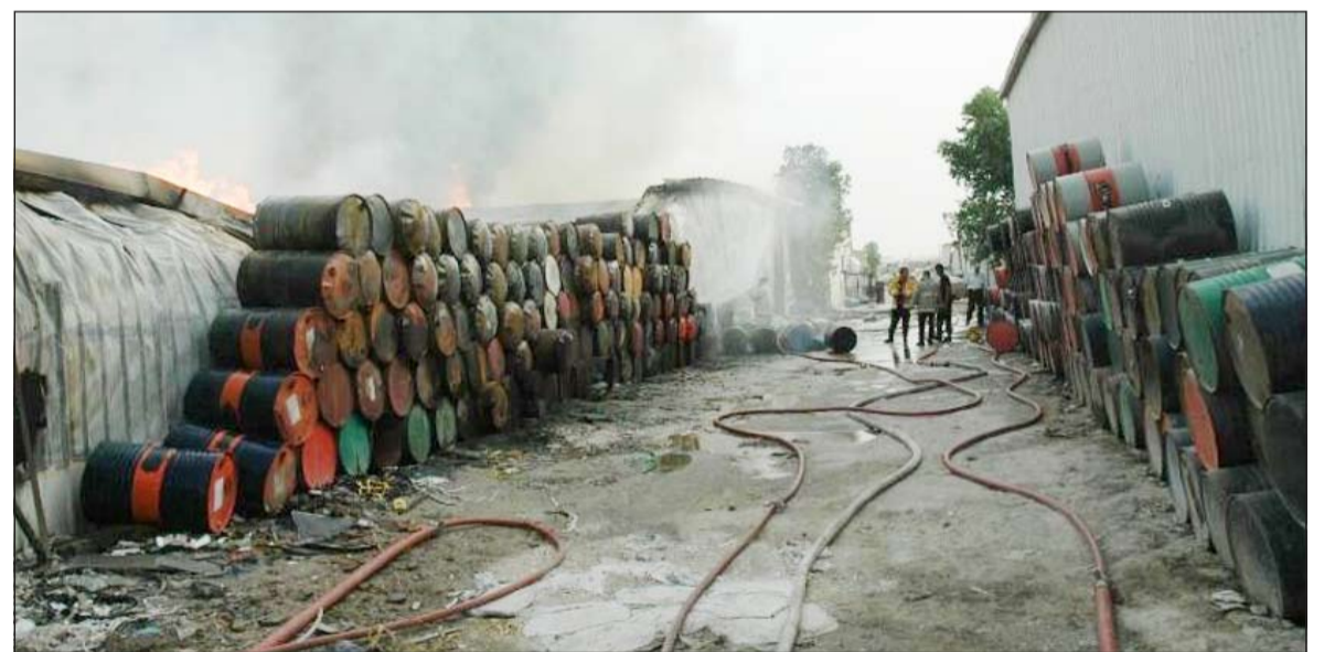
الحريق خلف سحبا دخانية كثيفة