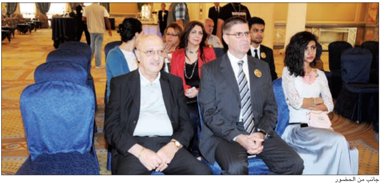
جانج من الحضور

ذكر السفير الماليزي إحصائيات مهمة، إذ زار ماليزيا 13195 زائراً من الكويت وذلك خلال 2012 مقارنة بانخفاض بـ 600 في 2013. ولفت إلى ان ماليزيا توجد بها حضارات متعددة مثل الهندية والكورية والتي تغني السائح عن السفر إلى البلاد المجاورة ماليزيا وبذلك ستعزز زيارة بلدان أخرى، مشيراً إلى انه خلال الصيف ستكون هناك مهرجانات ترفيهية متعددة ومنوعة. وقال ان حكومة ماليزيا بدأت تهتم بالسياحة منذ عام 1950 ولكن بدأ الترويج الحقيقي للبلاد منذ 1990، مشيراً إلى انه في عام 2014 ستكون هناك حملات وبرامج ترفيهية كثيرة لاستقطاب السياحة من جميع دول العالم، وذكر ان نجاح الحملات التسويقية تقاس بالأرقام، حيث استطاعت ماليزيا في عام 2012 استقطاب 25,3 مليون زائر مقارنة بـ 25,7 مليون زائر في 2013 أي بزيادة قدرها 2,7٪، مبيناً ان ذلك يعتبر نجاحاً باهراً. وقال ان السياح صرفوا ما يقارب 5,3 مليارات ديناراً على السياحة في ماليزيا.