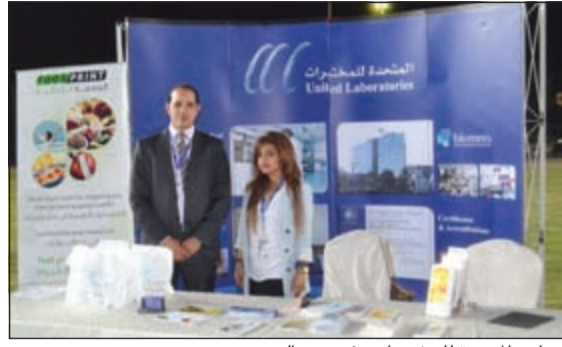
جناح «المتحدة للمختبرات» في يوم البيتم

450 شخصاً بالإضافة إلى عدد من المدعوين، وتضمنت الحفل العديد من الفعاليات والبرامج وشهد توزيع الجوائز والهدايا والألعاب، حيث قدمت الشركة المتحدة للمختبرات العديد من كوبونات تتضمن الفحوصات المجانية مثل: الفحوصات الشاملة وفحص البصمة الغذائية والعميد من الخصومات بنسبة 25٪ على مختلف التحاليل وقامت بتوزيع العديد من المنشورات الطبية التوعوية على أحدث التحاليل الطبية بالإضافة إلى الهدايا الرمزية للمدعوين. من جانبها،