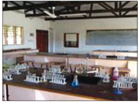
أحد معالم المدرسة