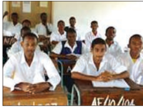
من داخل أحد الفصول

و يبلغ عدد المؤهلين لدخول الجامعة من المدرسة هذا العام 23 طالباً من أصل 31، ولا يتعدى متوسط عدد الطلاب في فصول المدرسة الأربعة 40 طالباً، حيث تراعى الجمعية جميع مدارسها للتقليل من الكثافة العددية في الفصول حتى لا تؤثر الكثافة سلباً على المردود التربوي والتعليمي للطلاب. وتعتبر مدرسة «آرابكو» الثانوية التي بنتها جمعية العون المباشر عام 2010 إحدى المدارس المتميزة