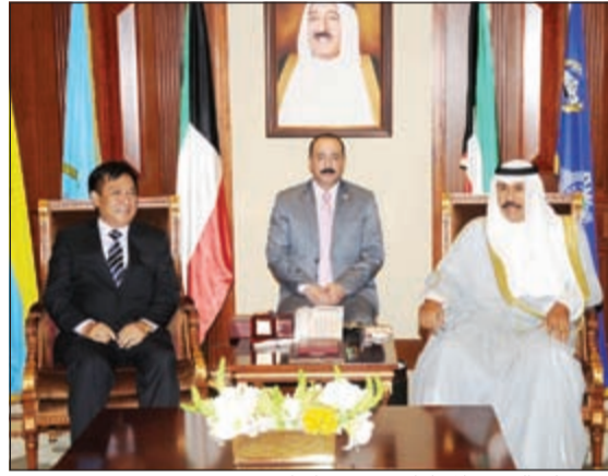
سمو ولي العهد خلال لقائه سفير ميانمار