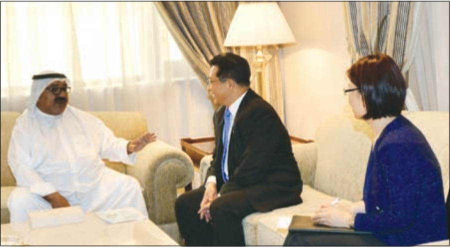
الشيخ ناصر صباح الاحمد مستقبلا سفير الصين

حياتتشون، حيث تم خلال اللقاء بحث نتائج الزيارة الرسمية التي قام بها إلى جمهورية الصين مؤخرا.