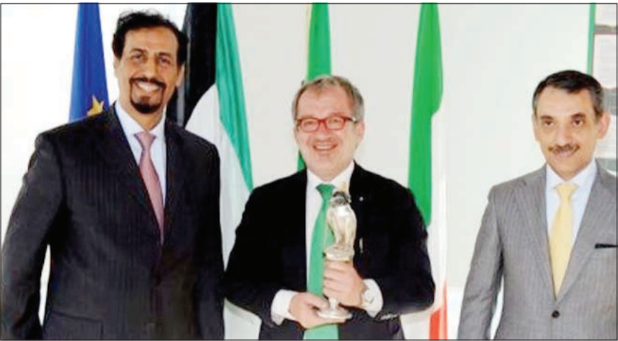
الشيخ علي الخالد مع رئيس اقليم «لومبارديا» روبرتو ماروني

وقال ان لقاءه مع رئيس اكبر الاقاليم الايطالية تناول تاريخ العلاقات الكويتية - الايطالية الوثيقة والدفعة القوية التي شهدتها عقب زيارة صاحب السمو الامير الشيخ صباح الاحمد التاريخية لاطاليا والتي بدأها من ميلانو في أبريل عام 2010 وأسفرت عن توقيع عدد من الاتفاقيات المهمة في مختلف المجالات. وتمن ماروني الذي يعد من أبرز زعماء شمال ايطاليا قرار الكويت المشاركة في أحد الأجنحة البارزة بين أجنحة الدول الكبرى في معرض «اكسبو ميلانو 2015» العالمي الذي تستضيفه العاصمة الاقتصادية لاطاليا لمدة ستة أشهر بمشاركة دولية غير مسبوقه زادت على 140 دولة.