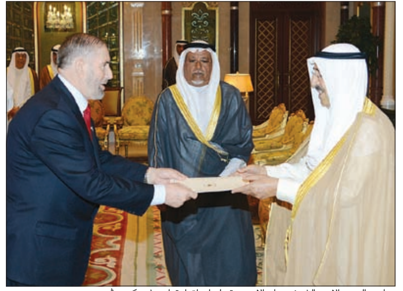
صاحب السمو الامير الشيخ صباح الاحمد يتسلم أوراق اعتماد سفير كوسوفو

وكيل وزارة الخارجية خالد الجارالله ومدير ادارة المراسم بسوزارة الخارجية السفير ضاري العجران وآمر الحرس الاميري بالإنابة العقيد ركن محمد سليمان الفرخان.