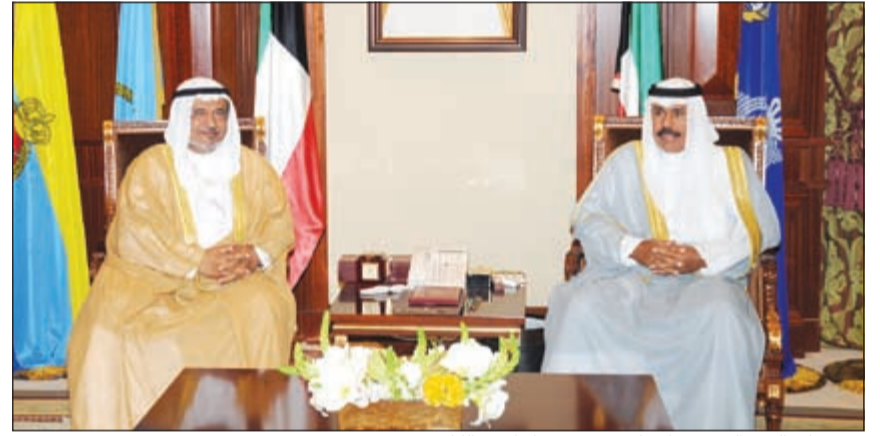
سمو ولي العهد الشيخ نواف الاحمد مستقبلا احمد الكليب

بيان صباح امس السفير فوق العادة ومفوض لجمهورية التشيك لدى الكويت مارتن فيتك وذلك بمناسبة توليه مهام منصبه الجديد سفيرا لبلاده لدى ديوان سمو ولي العهد للشؤون الإعلامية الشيخ مبارك الحمود السلطان.