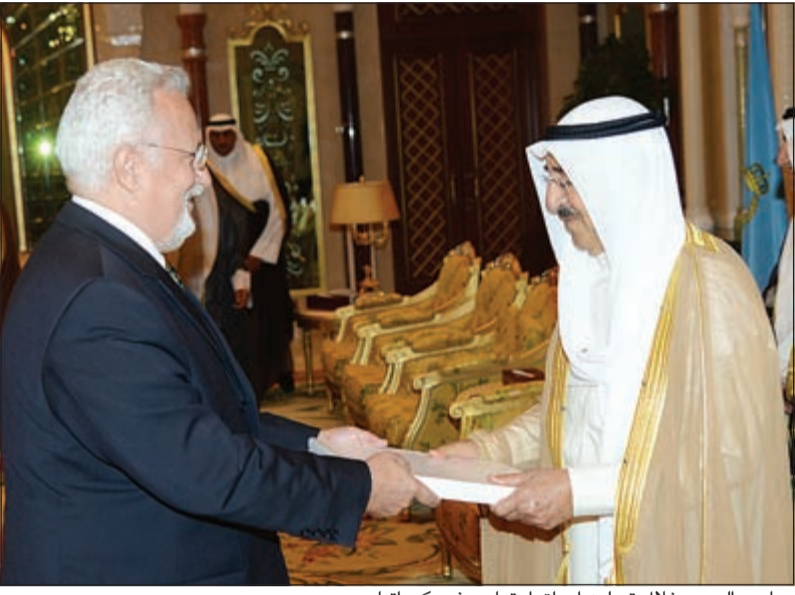
صاحب السمو خلال تسلمه أوراق اعتماد سفير كرواتيا