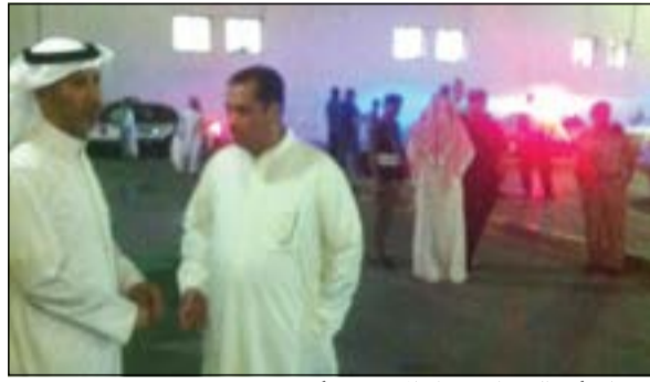
دوريات أمن الجهراء تحيط بالمستشفى أمس