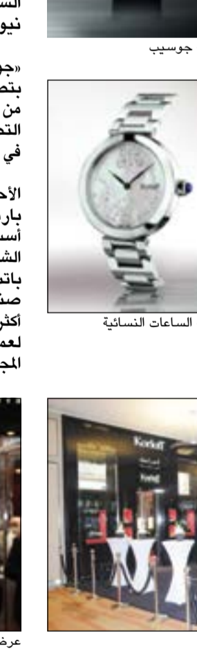
عرض ساعة جوسيب من كورلوف