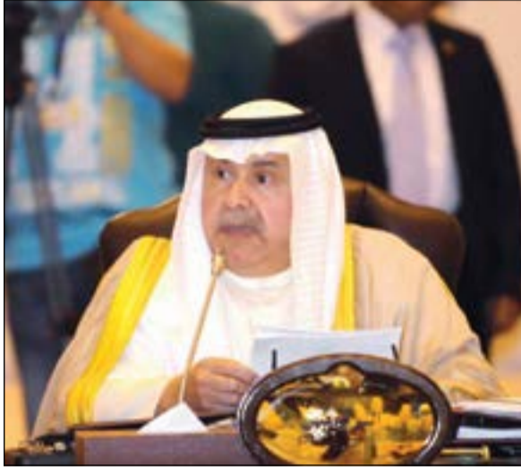
الفريق سليمان الفهد مترسدا الجلسة