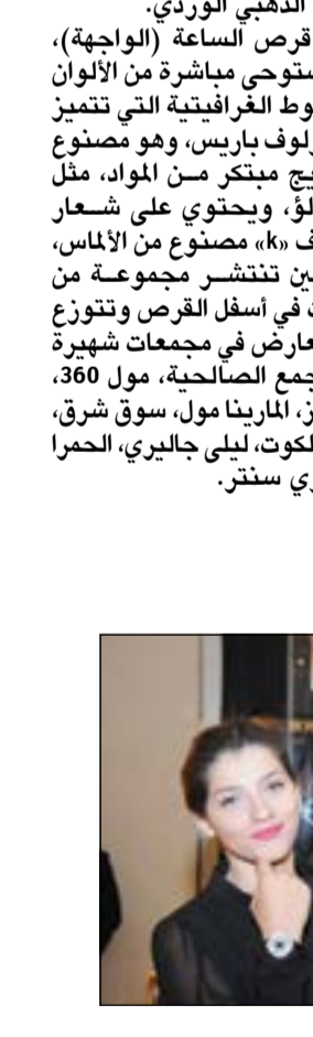
عرض ساعة جوسيب من كورلوف

في حين تنتشر مجموعة من المسات في أسفل القرص وتتوزع هذه المعارض في جمعات شهيرة مثل مجمع الصالحية، مول 360، الأفتيون، المارينا مول، سوق شرق، مجمع الكوت، ليلي جاليري، الحمرا لاجيري سنتر. عرض ساعة جوسيب من كورلوف