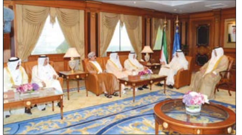
نائب رئيس مجلس الوزراء وزير الداخلية الشيخ محمد الخالد مستقبلا وكلاء الداخلية الخليجيين

30 الجاري. وقد رحب الخالد بوكلاء داخلية دول مجلس التعاون وأعضاء الوفود المرافقة وكذلك وفد الأمانة العامة لمجلس التعاون الخليجي الذي اثنى على جهوده في الإعداد والتحضير لهذه الاجتماعات، مؤكدا عمق العلاقة التي تربط بين الأشقاء في دول المجلس، والسعي الدائم للحفاظ على أمن دول الخليج وأمان مواطنيها من خلال آلية عمل واستراتيجية أمنية موحدة ومتكاملة لمحاربة الجريمة بشتى أنواعها والعمل على الوقاية منها قبل وقوعها.