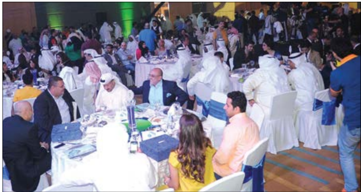
جانب من الحضور الكبير لحفل دورة رمضان 2014 لتلفزيون الوطن