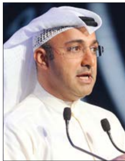
الإعلامي عمار معرفي