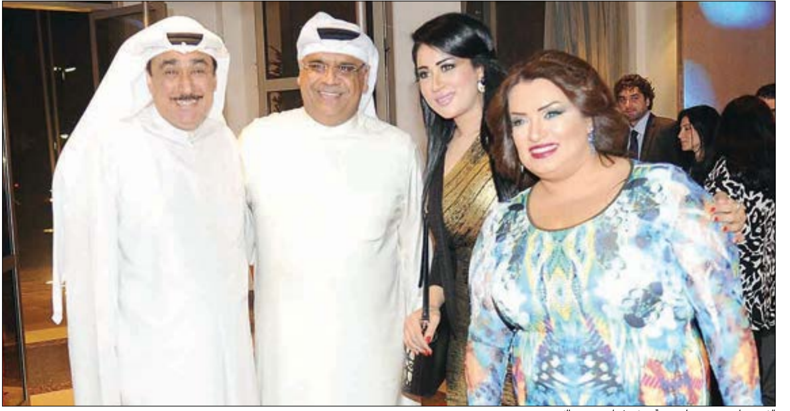
النجوم داود حسين وعلي جمعة ومنى شداد ومي عبدالله