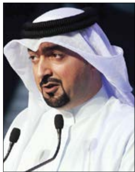
الإعلامي هاني الوزان