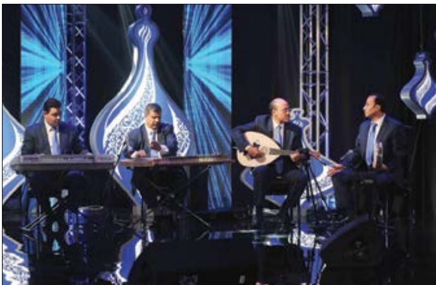
الفرقة الموسيقية وأجمل المعزوفات