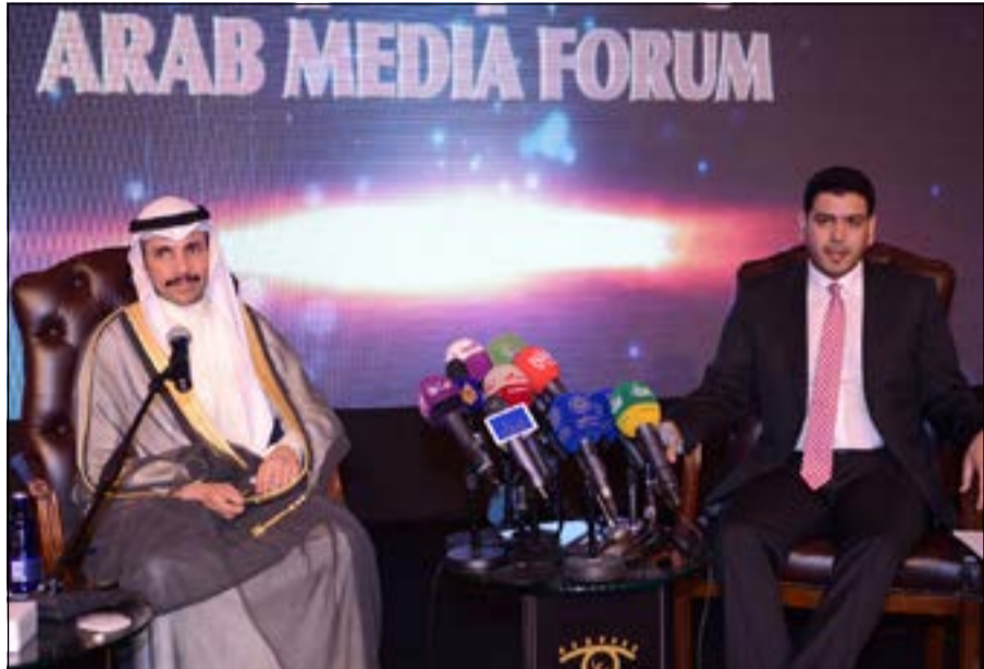
رئيس مجلس الأمة مرزوق الغانم خلال مشاركته في فعاليات المنتدى الإعلامي العربي الحادي عشر مع الزميل عادل عبيدان

وقال الغانم، في لقاء مفتوح مع الإعلاميين المشاركين في المنتدى الإعلامي العربي الـ11، والذي عقد ظهر أمس وإداره مدير مكتب قناة «العربية» في الكويت عادل العبدان، إن سقف الحرية دائما يرتبط بالمسؤولية، والإعلام بالطبع حاله لا يختلف عن أي دولة فيها سقف حرية عال.