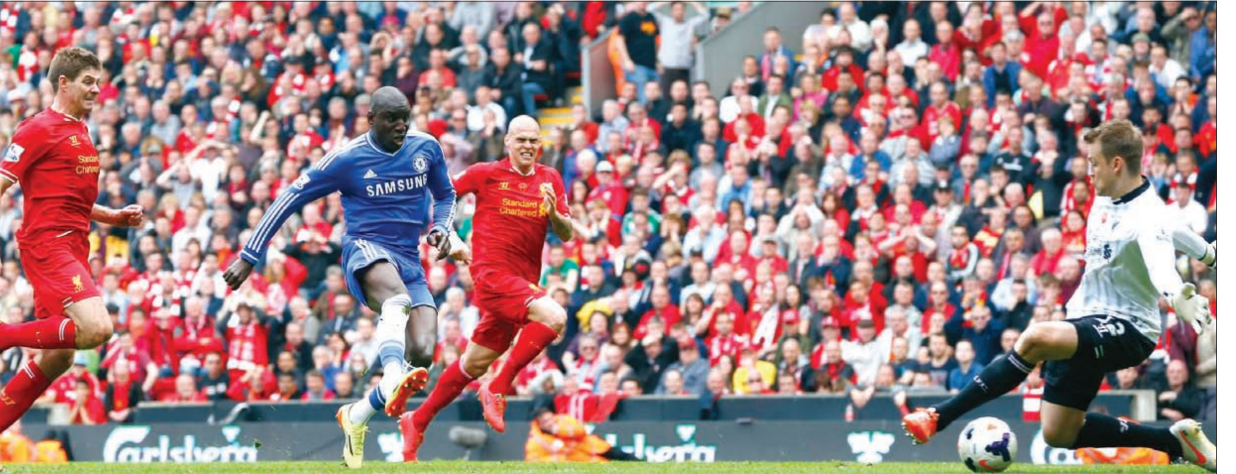
أنتيكو يعزز صدارته.. و«الملكي» يوجه رسالة قوية لرجال غوارديولا