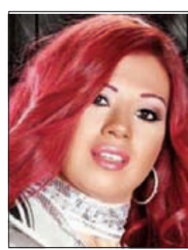
رانيا فريد شوقي