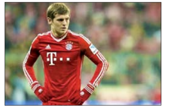
عدم اعتماد غوارديولا على كروس يعجل برحيله عن الباتاري

كشفت تقارير صحافية ان انتقال خافي مارتينيز لاعب وسط بايرن ميونخ الألماني الى برشلونة الإسباني في فترة الانتقالات الصيفية المقبلة قد يكون بمنزلة ضربة موجعة لمان يوناييتد الإنجليزي الذي يريد الحصول على زميله توني كروس.