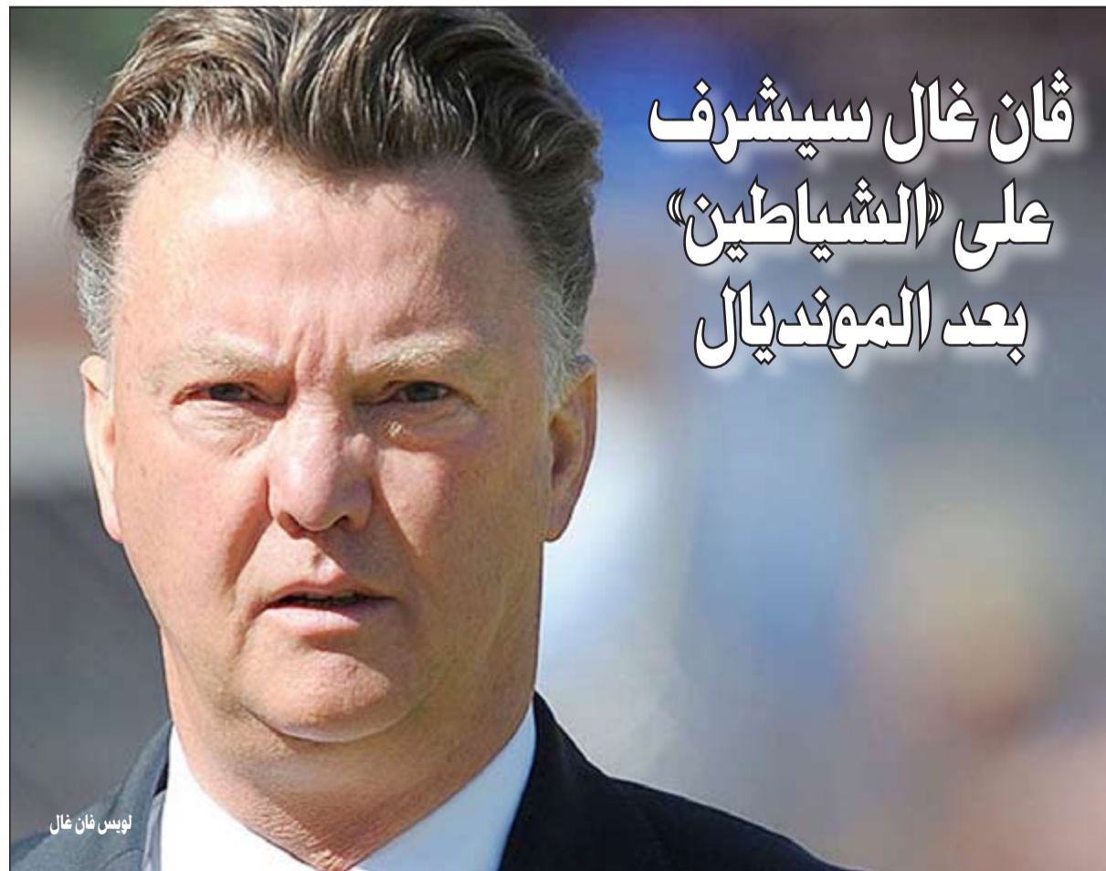
لويس فان غال

يذكر ان سوبر ماريو انضم للروسينيري يناير العام الماضي قادما من مانشستر سيتي الإنجليزي.